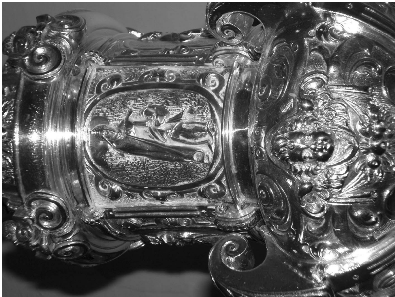
Figura 2: Cruz parroquial (detalle). Iglesia ex-colegial de Olivares.