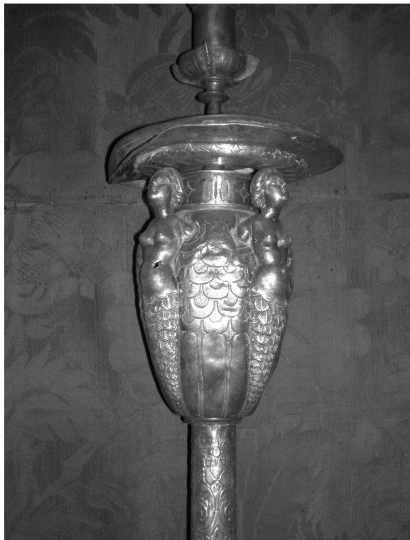
Figura 3: Cirial. Iglesia ex-colegial de Olivares.