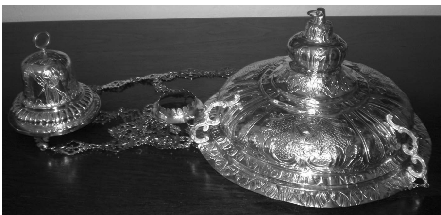
Figura 4: Lámpara de S. José. Iglesia parroquial de Ntra. Sra. de Consolación. Umbrete (Sevilla).