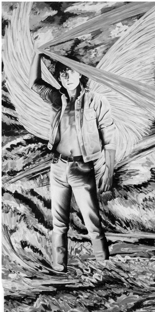
Figura 4. San Miguel, Los Cuatro Arcángeles, 1982.