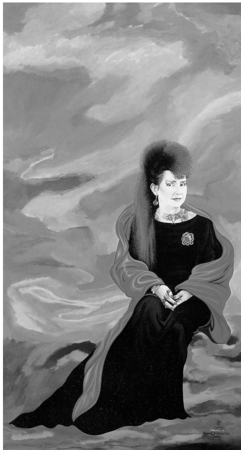
Figura 2. Virtudes Cardinales, La Prudencia, 1984.