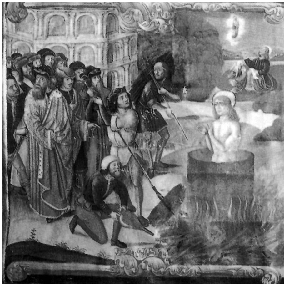
Figura 9. Libro de Coro del Monasterio de Guadalupe nº 19, fol.18.