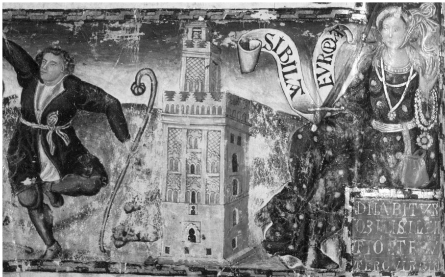
Figura 10. Libro de Coro de la Catedral de Sevilla nº65, fol. 1 v.