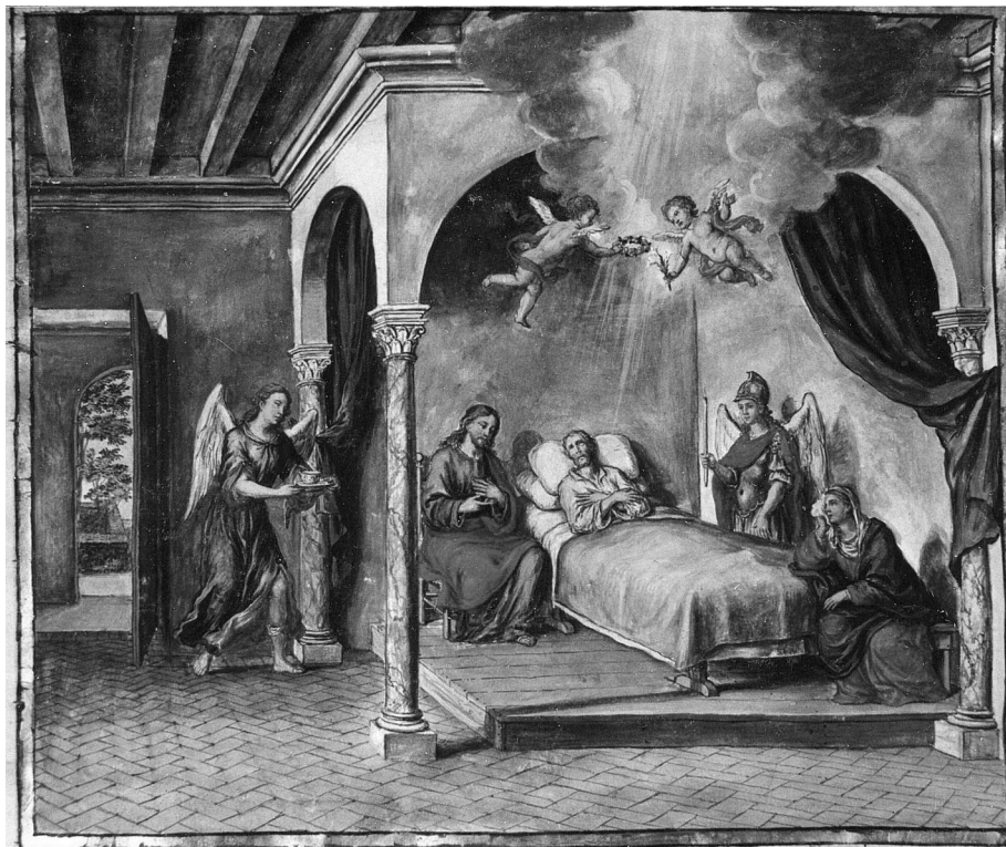
Figura 4. Libro de Coro de la Catedral de Sevilla nº10 fol. 45 v.