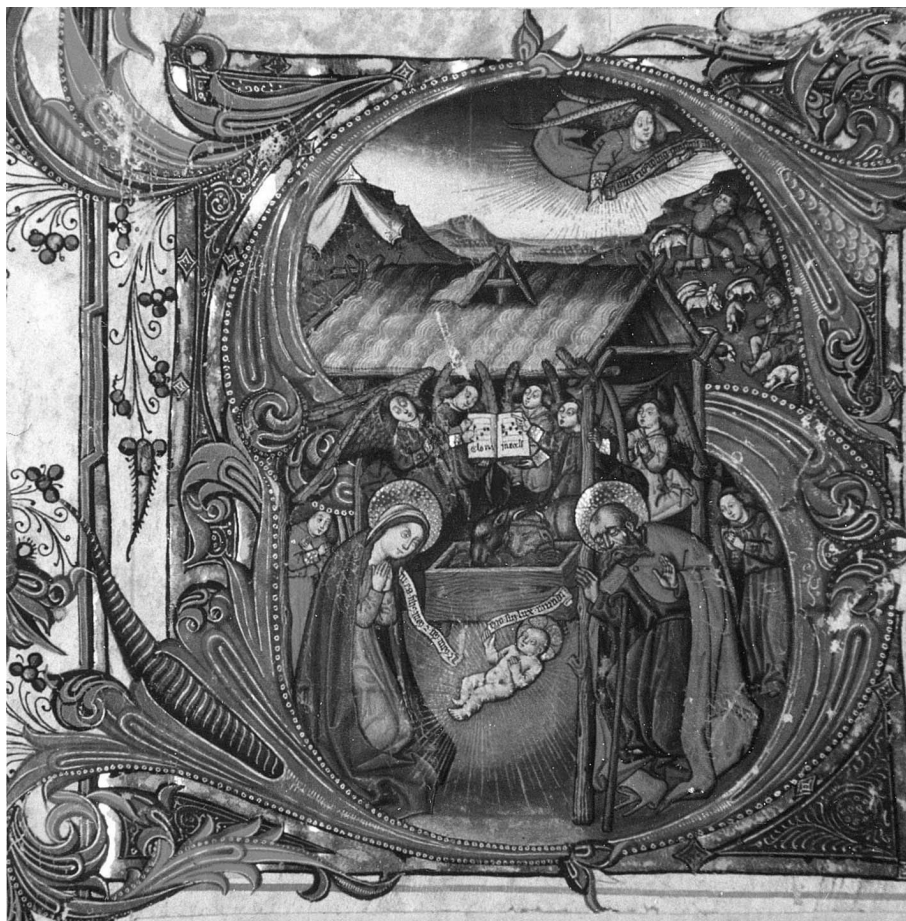
Figura 1. Libro de Coro de la Catedral de Sevilla, nº 63, fol. 1 vt.