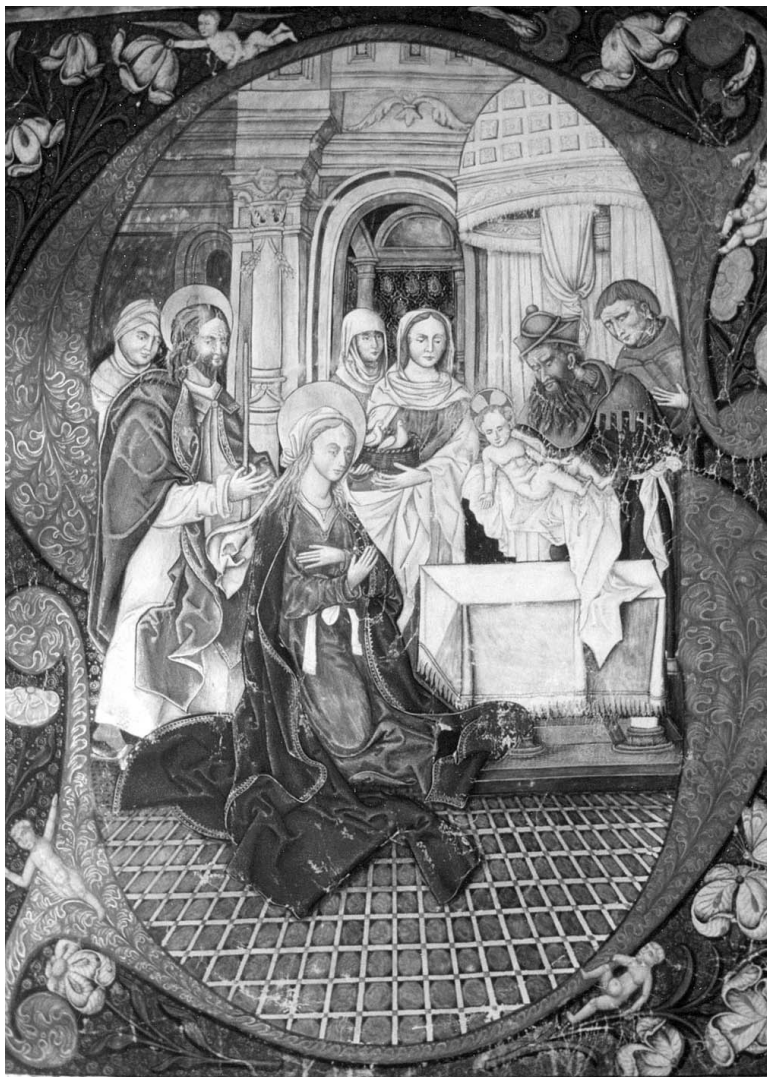
Figura 6. Libro de Coro de la Catedral de Sevilla nº 33, fol. 11 v.