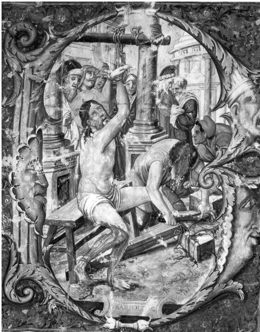
Figura 7. Libro de Coro de la Catedral de Sevilla nº 32. pág. 2.