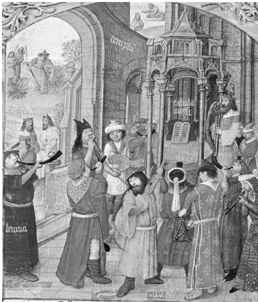
Figura 5. Breviario de Isabel la Católica, fol. 155 v.