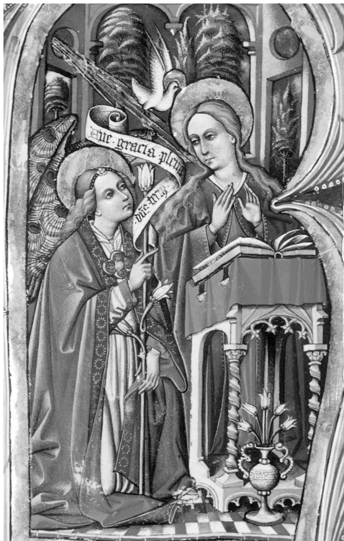
Figura 2. Libro de Coro de la Catedral de Sevilla nº 89, fol. 28.