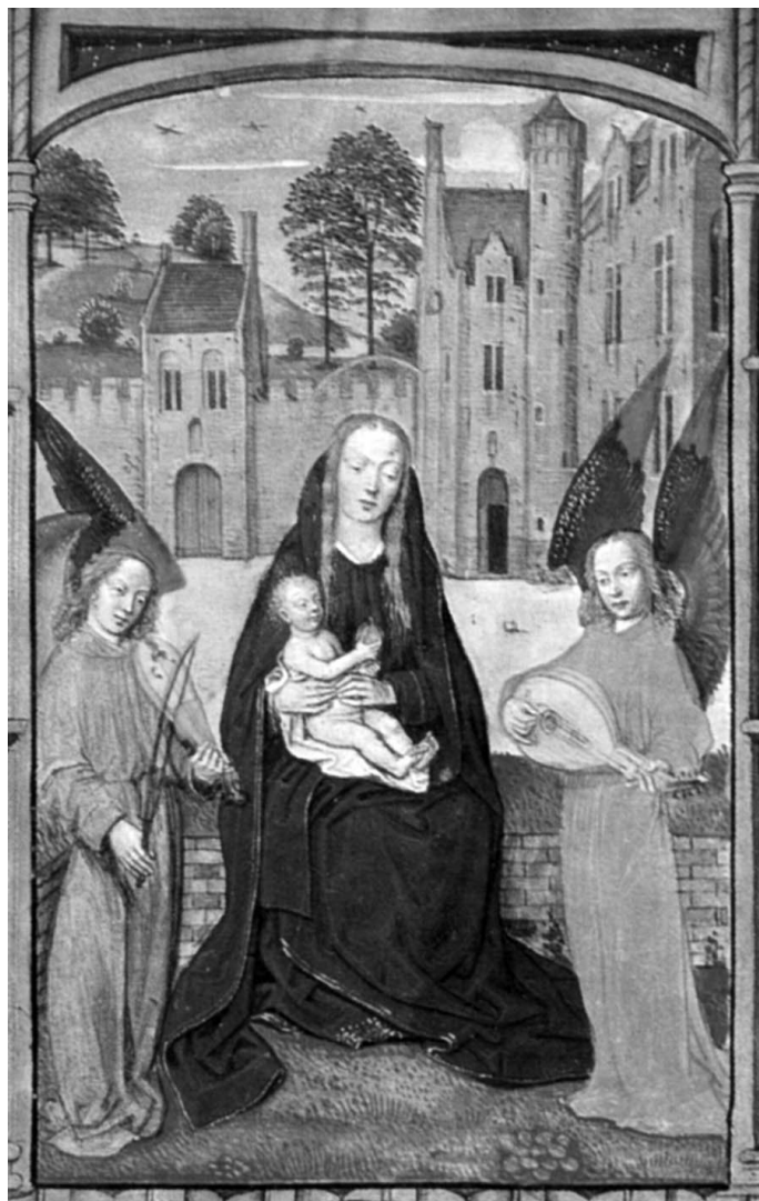
Figura 8. Libro de Horas de la familia Ayala.