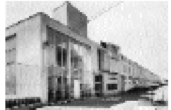
Fábrica de Tractores Vender, Cusano Milanino, Milán (1942). Mario Asnago y Claudio Vender.

En un momento como el actual, donde no existen concepciones absolutas sobre los lugares, donde el paisaje es algo inventado. Cuando surge una arquitectura sin forma, que aparece en el territorio sin interferir, sin construir, sin estar. Cuando aparecen conceptos como ‘fragmentación’, ‘arquitectura como paisaje’ o ‘paisaje como arquitectura’, se sustituye la