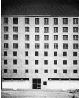
Edificio de viviendas en plaza Velasca Milán (1947-52). M. Asnago y C. Vender.