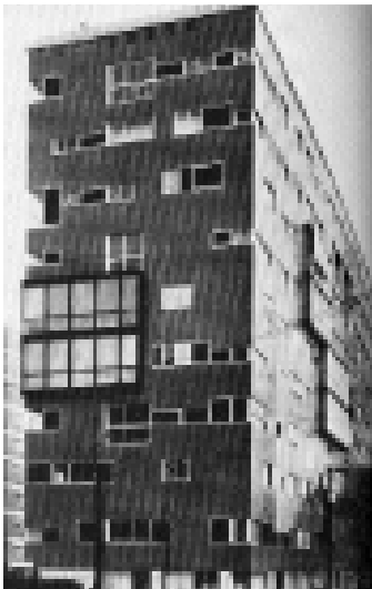
Edificio de viviendas, via Ippolito Nievo (1955). Luigi Caccia Dominioni.

limpios muros—cortina al material tallado en piedra. Su eclecticismo lingüístico está determinado por la conciencia de una necesaria fragmentariedad proyectual del propio oficio, imposibilitado de dar una respuesta tipológica homogénea a los numerosos interrogantes planteados en la Italia del ‘ miracolo economico ’.