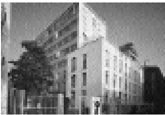
Condominio XXI Aprile, via Lanzzone, Milán (1950). Mario Asnago y Claudio Vender.

interpretaciones plurales y contradictorias. El ojo no encuentra reposo, lugar donde agarrarse; los diversos elementos del alzado no se dejan reconducir a una figura unívoca, estable, equilibrada y, sin embargo, se reconoce un orden.