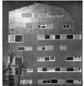
Edificio de viviendas en plaza Carbonari, Milán (1960-61). Luigi Caccia Dominioni.