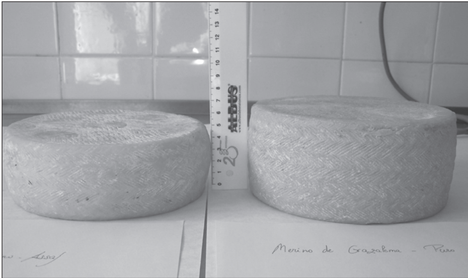
Figura 2. Apreciación visual de las diferencias encontradas en el período de maduración de ambos tipos de quesos.

Como vemos, las ovejas cruzadas producen más cantidad de leche, pero con menor calidad (grasa, proteína y extracto seco), y con menor rendimiento quesero.