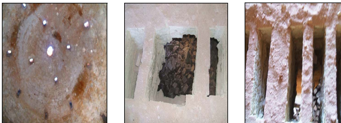
Figura 6. Partes que componen el Horno de Roa.