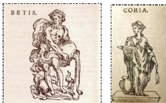
Figura 3. Alegorías .Fuente: Yañez-Barnuevo, 1987, p. 12 y Pineda, 1968, p. 45 respectivamente.

Esta representación de sus iconos evidencia el hecho de la índole y cualidades otorgadas al Río, tanto en sus aspectos económicos, como en lo simbólico y lo identitario. Desde esta percepción, es sustancial que el escudo haya permanecido a lo largo del tiempo: ‘Barca, Peces y Río’ suponen, efectivamente, sus señas de identidad, reflejando la personalidad de Coria del Río, de modo que si estas señas desaparecieran presagiamos en cierta manera la desaparición de parte de la historia de un pueblo 8 :