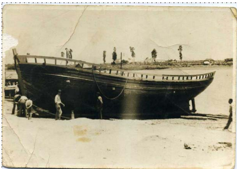
Figura 4. El “María Lourdes” conocido como el Betis.

La barca coriana que se muestra en la Figura 4 se creó con la función de ser un barco arenero. Se conocía como el Betis por estar pintado de verde y blanco, de 75 toneladas era el barco coriano más grande de los primeros años cincuenta. Actualmente está en el fondo del río , enfrente del taller artesano a orillas del Guadalquivir, según informaba su propietario y constructor.