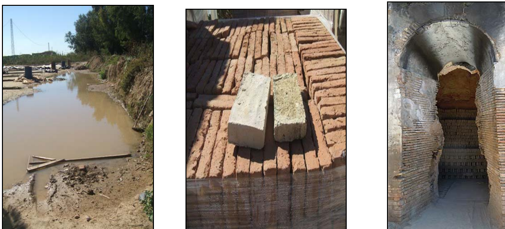
Figura 5. Fotos de la Finca el Tejar.

experiencia y el saber del oficio del barro impulsó al maestro artesano arenero coriano, - adquiridos a través de su padre y su tío paterno- a poner en funcionamiento (1996) unos hornos que ya estaban en desuso y olvidados. En la Figura 5 a la izquierda instrumentos, materiales y materias primas: la arandá donde se hace la argamasa de barro. La foto central son ladrillos: uno fabricado con barro bueno presenta un acabado de calidad y el otro al coger grea , produce un ladrillo deteriorado. A la derecha Horno de Roa (BIC). En la Figura 6 aparece la cúpula interior del horno a la derecha, en el centro se aprecia abajo la leña preparada para encenderse en el hormillón , en la izquierda se observa las rejillas por donde traspasa el calor de la leña y se colocan los ladrillos. Hace falta mucha intuición y sensibilidad personal . A día de hoy, una de las mayores preocupaciones radica en que la herencia cultural de sabiduría y de conocimientos artesanales no tiene destinatarios que acumulen esa tradición artesanal para reproducirlos socialmente, con la consecuente pérdida del oficio tradicional de fabricación de ladrillos artesanos, además de otros artefactos como tinajas, canales y tejas árabes.