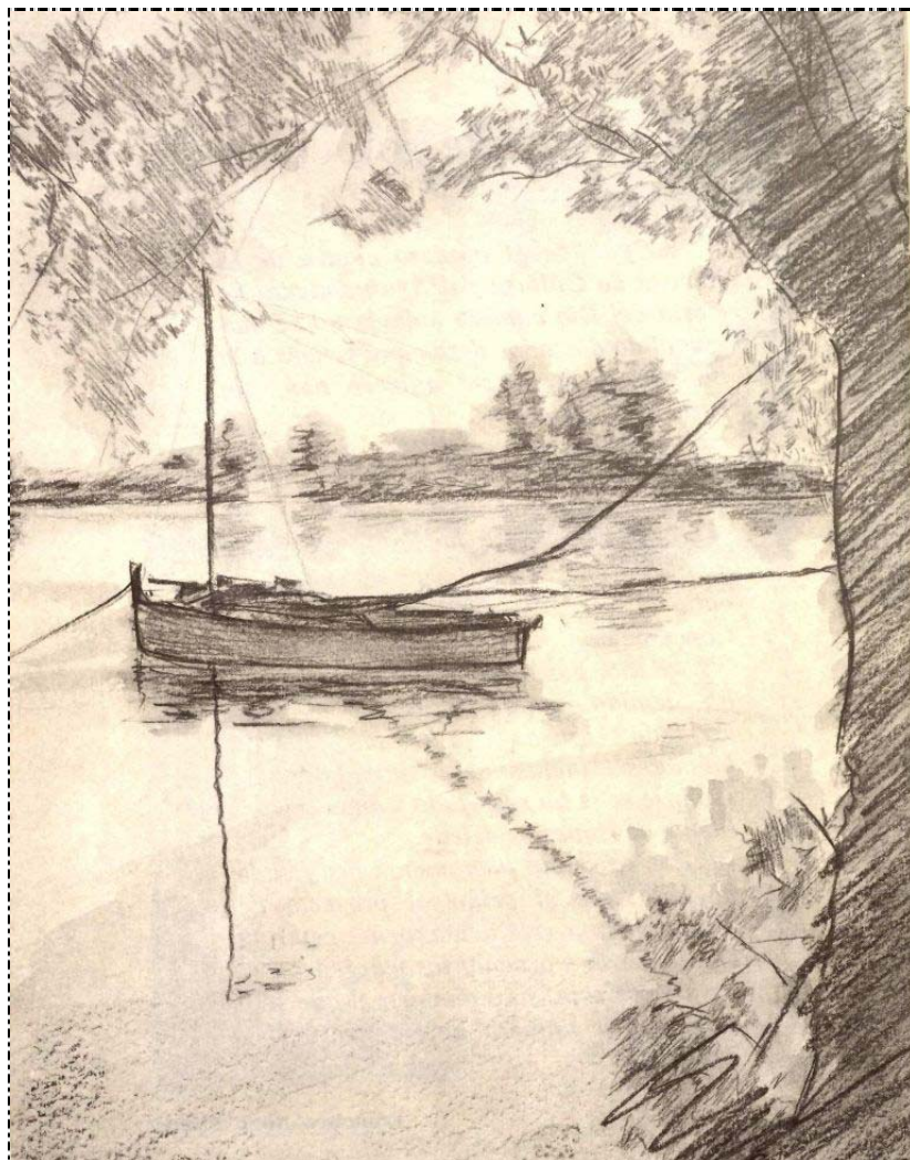
Guadalquivir por Coria del Río