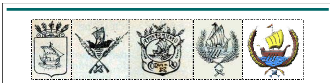
Figura 2. Evolución histórica de la heráldica municipal de Coria del Río.

Analizando el territorio y la identidad coriana, más abajo en la Figura 2 examinamos como ejemplo la evolución iconográfica de la heráldica municipal coriana. En ella es de destacar como, en su historia, a través del imaginario colectivo de ese pueblo, se exterioriza prolongadamente el fenómeno sociocultural de evaluar la barca coriana, el Guadalquivir y los peces. En esta figura aparece al extremo derecho del lector el actual escudo coriano, en el que queda patente esta continuidad en la historia de esos marcadores culturales de autoidentificación 7 .