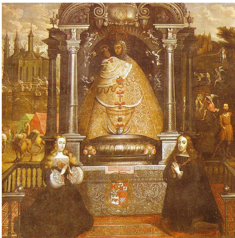
Imagen N° 2 “La adoración de la virgen del Almudena” - Basilio Santa Cruz.

A unos pocos metros se ubica un importante lienzo titulado “La adoración de la virgen del Almudena”, pintado por el artista mestizo Basilio Santa Cruz (Imagen N° 2), En la explicación nuevamente se nos muestran elementos andinos, perceptibles solamente para la población local lo que hace necesaria la intervención de un guía turístico.