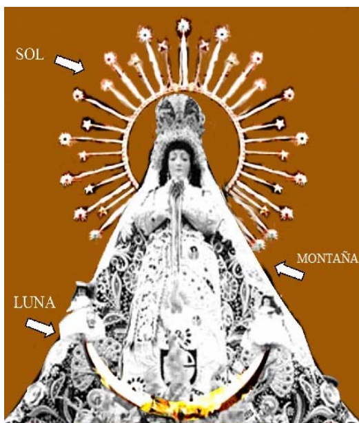
Imagen N° 1 Virgen Inmaculada Concepción – Anónimo.

Muchos de los guías turísticos hacen mención a dos esculturas que representan a Jesucristo camino al calvario, según la explicación el primero era de origen español y el segundo de factoría local, para corroborar dicha afirmación se nos muestra las excesivas llagas o cortes que cubren el cuerpo de la segunda imagen, según la explicación representan los excesivos maltratos a los que fueron sometidos los pobladores indígenas durante la colonia y que él artista habría intentado reflejar durante la creación de esta escultura.