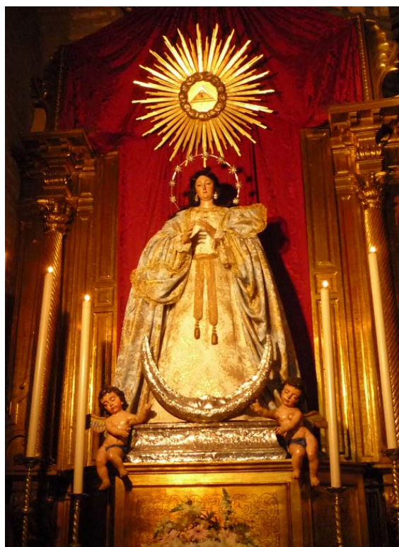
Imagen N° 7 “Inmaculada Concepción” (Sevilla) – Cristóbal Ramos.

Es en este punto donde nos preguntamos si en verdad las vírgenes son o no son representantes de la religión Inka. Una posible solución a dicha pregunta la encontramos en las pinturas de la escuela cusqueña donde si se llegan a hacer comparaciones entre ambas religiones, está claro que si la pintura cusqueña fue influenciada por la europea, también hizo lo propio la escultura virreinal 9 , por consiguiente creemos que es posible que en las esculturas coloniales también existiese una doble apreciación. Sin embargo, consideramos que las explicaciones se deben hacer mayormente sobre los lienzos por ser estos los que poseen mayores estudios científicos e información bibliográfica.