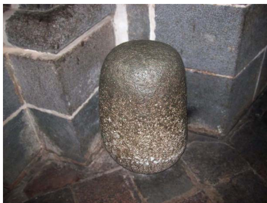
Imagen N° 3 Roca circular ó Hatun Take Wiracocha.

En la entrada principal de la catedral nos llama la atención una roca circular (Imagen N° 3) que según la explicación de muchos guías e incluso pobladores locales sería la representación de Hatun Taque Wiracocha (El gran conjurador Viracocha), una especie de representación divina de origen Inka al que la narrativa local atribuye poderes milagrosos y que dicen ayuda a limpiar los pecados, esta roca sería otro elemento Inka que habría sobrevivido en el tiempo y que los diferentes cambios en la sociedad cusqueña no habrían podido eliminar.