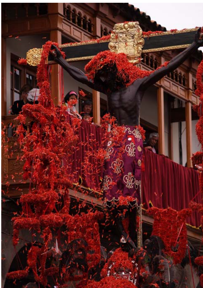
Imagen N° 4 “Señor de los Temblores” - Anónimo

Sin duda el más célebre de los milagros fue el que aconteció en la ciudad del Cusco en el año de 1650, donde un terremoto casi destruye la ciudad y que sólo dejó de temblar cuando la población decidió sacar en procesión la imagen de este Jesucristo. Dentro de la catedral existe un lienzo que fue mandado a pintar por Alonso Cortez de Monroy, donde se puede apreciar la ciudad del Cusco casi destruida y en medio de ella la imagen de Jesucristo crucificado rebautizado desde ese entonces como el “Señor de los Temblores”. Desde entonces la imagen sale en procesión solo los lunes de semana santa, día en el que la población acude masivamente a recibir su bendición.