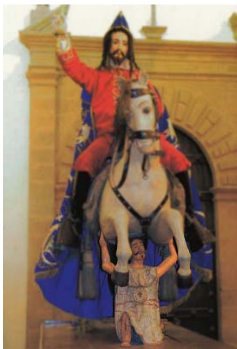
Imagen N° 6 "Santiago Apóstol" - Anónimo.

Dicen que por muchas décadas los párrocos y curas de la catedral intentaron transformar esta imagen en una que se pareciera más a la europea, añadiendo a la figura del indígena atuendos y pintándole bigotes. Hoy, después de los trabajos de restauración esta imagen luce en su estado original y sirve a los guías como ejemplo de la transformación y el sincretismo religioso.