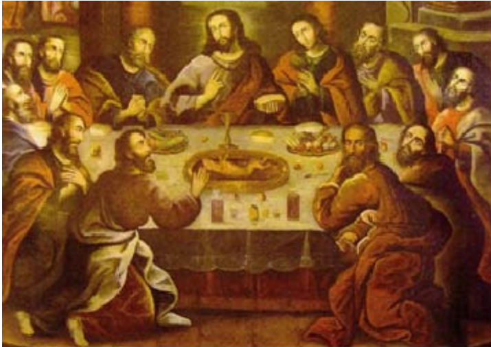
Imagen N°5 "Ultima Cena"- Marcos Zapata

Al lado derecho de dicho lienzo se encuentra el altar del Señor de Unu Punku (Puerta del agua), que es la representación en busto de Jesucristo, muchos guías cuentan que debajo de la catedral existe una laguna donde se esconden grandes tesoros y que esta posee un acceso secreto que estaría