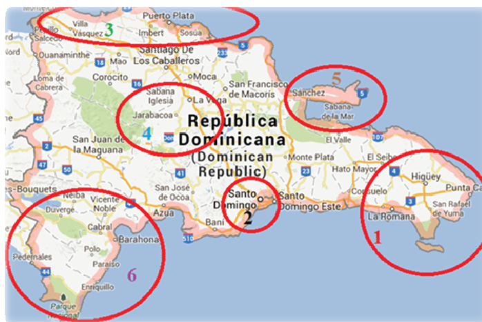
Figura 1. Mapa polos turísticos de República Dominicana.