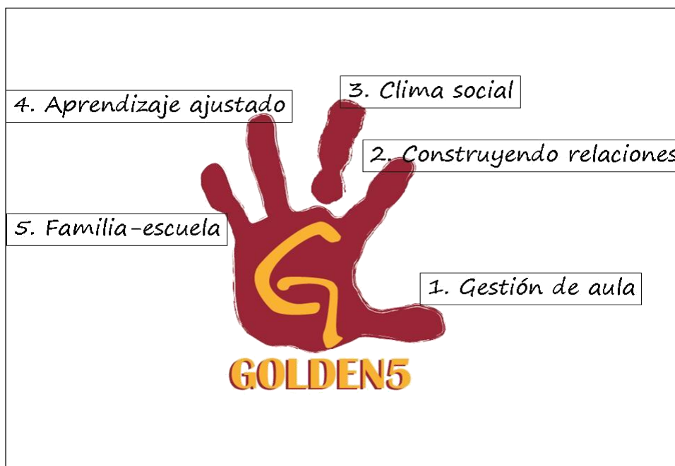
Ilustración 2. Áreas Golden

El programa Golden5 se estructura en cinco áreas, llamadas áreas Golden y que consideramos necesarias y relevantes para que el profesorado pueda cambiar su aula, y ayudar al alumnado que más lo necesite (ver cuadro 2).