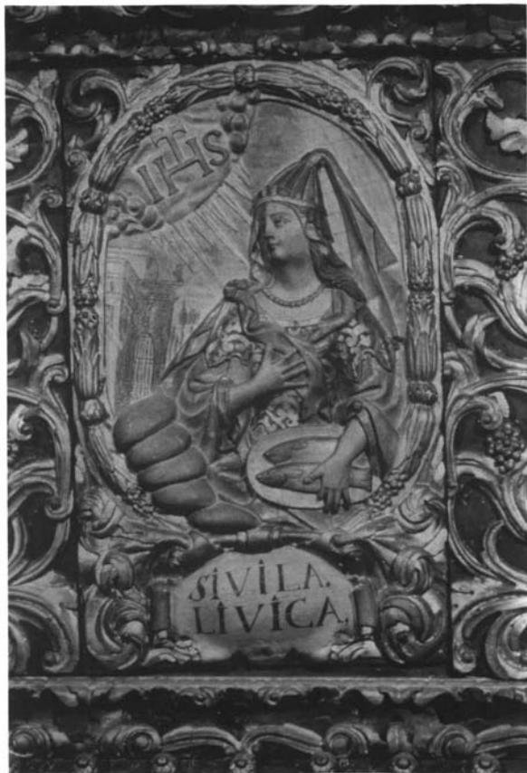
5. Catedral de Ourense. Capilla del Sto. Cristo. "Sibila Libica".