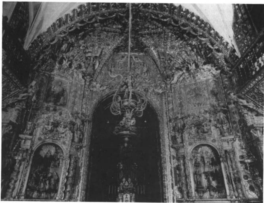
3. Catedral de Ourense. Capilla del Sto. Cristo.