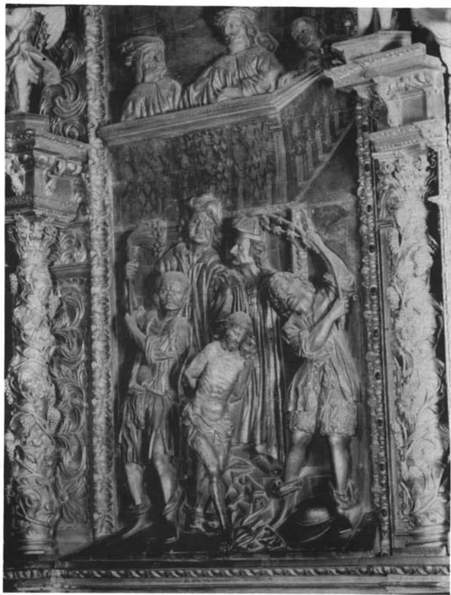
4. Catedral de Ourense. Capilla del Sto. Cristo. "La Flagelación".