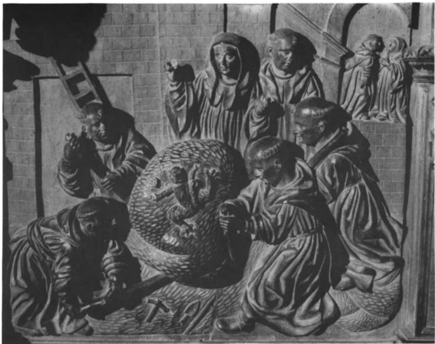
1. Monasterio de Celanova. Sillería de coro. "La piedra aligerada de su peso".