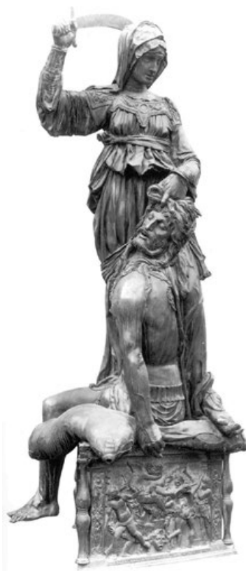
Figura 12. Judith y Holofernes . Donatello. Palazzo Vecchio. Florencia, 1460.