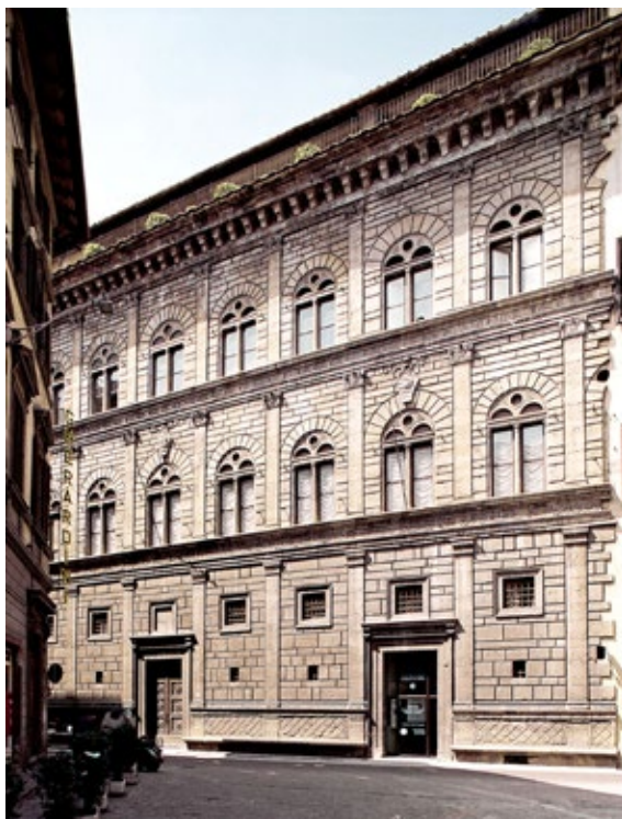
Figura 5. Vista de la fachada del Palazzo Rucellai . Leon Battista Alberti. Florencia, 1460.