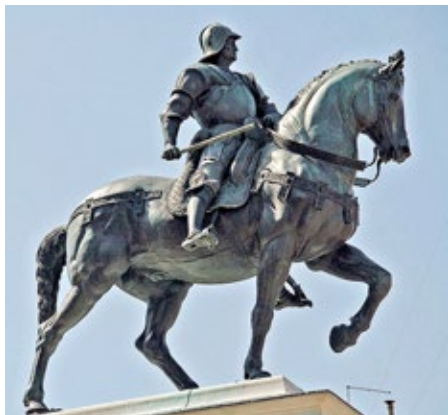
Figura 10. Bartolomeo Colleoni . Andrea Verrocchio. Venecia, 1481.