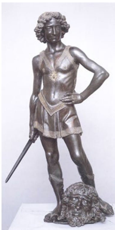
Figura 8. David . Andrea Verrocchio. Palacio Bargello. Florencia, 1467.