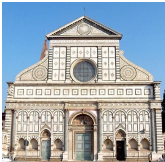
Figura 6. Fachada de Santa Maria Novella. Leon Battista Alberti. Florencia, 1470.