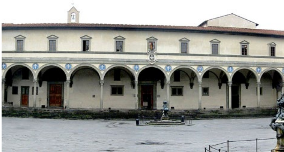
Figura 1.. Loggia exterior del Ospedale degli Innocenti . Filippo Brunelleschi. Florencia, 1419.