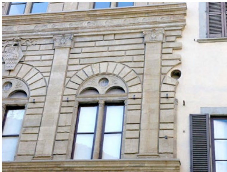
Figura 3. Detalle del séptimo lienzo en la fachada del Palazzo Rucellai . Leon Battista Alberti. Florencia, 1460