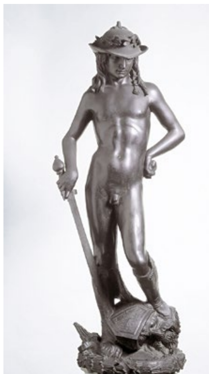
Figura 9. David . Donatello. Palacio Bargello. Florencia, 1440.