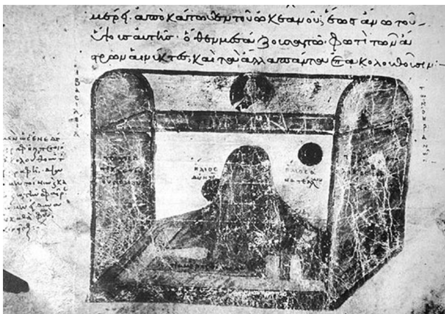
Figura 2. Representación del planeta Tierra según Cosmas Indikopleustes, en Topografía cristiana , c.550.