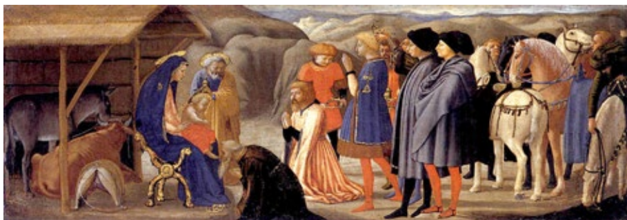
Figura 7. La Adoración de los Reyes Magos . Tabla central en la predella del Políptico de la iglesia de Santa Maria del Carmine. Masaccio. Pisa, 1426.