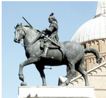
Figura 11. Gattamelata . Donatello. Padua, 1453.