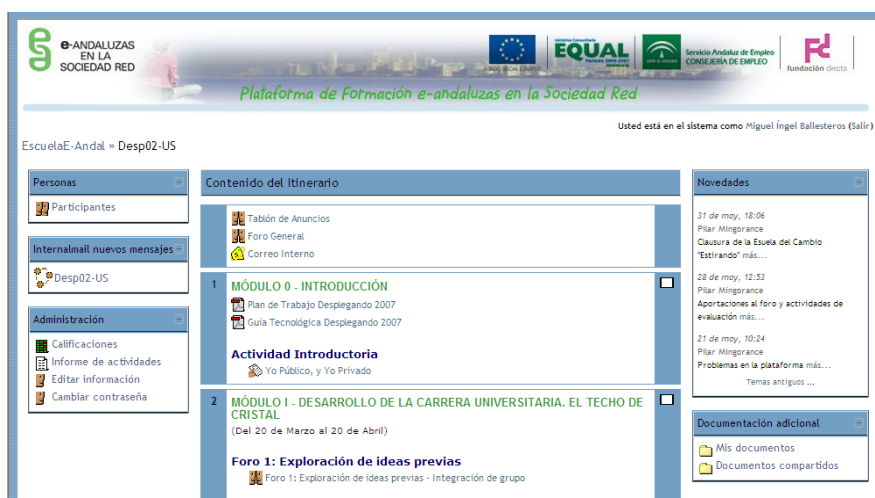
Figura 1. Interface de Moodle en el contexto formativo de la Escuela

La Iniciativa Comunitaria Equal pone énfasis en la potenciación de la igualdad de género, desarrollando acciones formativas, con el trasfondo del aprovechamiento del potencial tecnológico que nos brinda la Sociedad de la Información y el Conocimiento. El proyecto e-Andaluzas en la Sociedad red ha integrado todos estos aspectos desarrollando acciones de formación on-line, como son las Escuelas Estirando y Desplegando, empleando para ello la plataforma tecnológica Moodle, un CMS (Course Management System) basado en el software libre, que ayuda a los formadores a crear comunidades de aprendizaje on-line. La Escuela del Cambio Desplegando ha integrado las TICs en el proceso formativo utilizando una plataforma telemática como aula virtual en el que desarrollar los contenidos y facilitar el intercambio comunicativo dentro del alumnado y para con las tutoras. La figura 1 muestra el interface de la plataforma empleada en este curso: