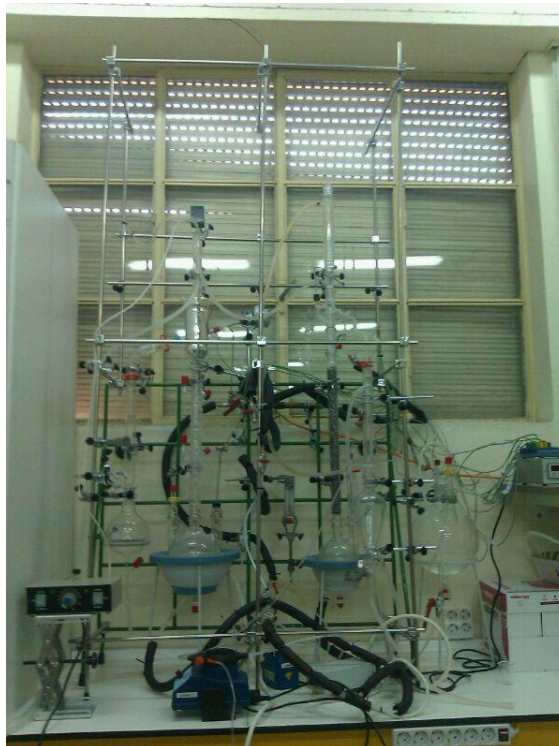
Fig. 2: Unidad de Destilación

Las últimas dos sesiones se dedicaron a la puesta en marcha y a la operación de la planta. Previamente, los alumnos confeccionaron un manual preliminar de operación de la instalación y se procedió a la ejecución de pruebas de estanqueidad y fugas. Estas pruebas consistieron en el llenado de los depósitos e intercambiadores y en la circulación de agua mediante el sistema de bombeo por todas las líneas de la instalación, apareciendo diversos problemas de fugas y mal conexionado de líneas e instrumentación.