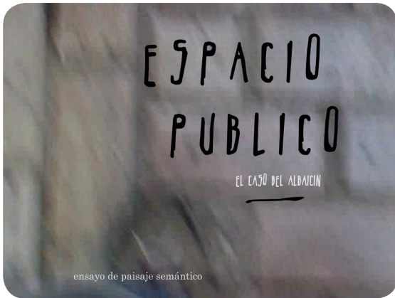
Ensayo de paisaje semántico

También, se han ensayado colecciones de paisajes que actúan a la postre como uno más de ellos. “¿Dónde está ahora el valor? Posiblemente en el filtrado, la agregación y la remezcla y en la conexión intelectual y emocional con los usuarios. Llega la era de los comisarios digitales (algunos de ellos actuando como brokers de conocimiento)” 6 . En la línea de la emergente posición del “curator” digital, se componen estas colecciones o selecciones de material producido y depositado por los estudiantes. Para la descripción de un tipo heterogéneo de vecinos se recurre a una colección 7 de paisajes que giran alrededor de la gastronomía y un concurso vecinal de tapas o aperitivos. Y finalmente, todo el material producido se refunde en el Portal:Albaicín 8 . Paisaje semántico que cristaliza la contemporaneidad de nuestra inmersión.