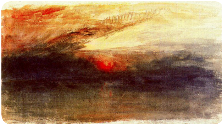
Crepúsculo con nubes oscuras. William Turner, 1826 ( http://pintura.aut.org/SearchProducto?Prodnunm=28100 )