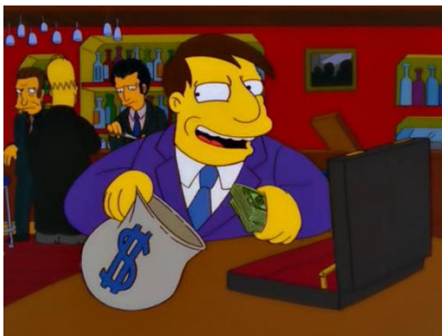
Imagen 3. Imagen del texto “Venden la Alcaldía” (Lógica- Ética- Estética, 2015. Disponible en: www.logicaeticayestetica.com/post/venden-la-alcaldia/173 )

Estas consideraciones sobre el análisis textual se complementan con el aplicado a la imagen que acompaña a este discurso (véase imagen 3).