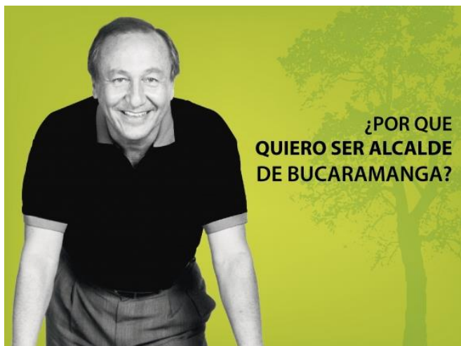
Imagen 4. Imagen del texto “¿Por qué quiero ser alcalde de Bucaramanga?” (Lógica- Ética- Estética, 2015. Disponible en: www.logicaeticayestetica.com/por-que-quiero-ser-alcalde-de-bucaramanga/175 )

Ahora bien, para avanzar en la línea de análisis, a continuación se revisará la imagen que acompaña a este discurso. (Véase imagen 4)