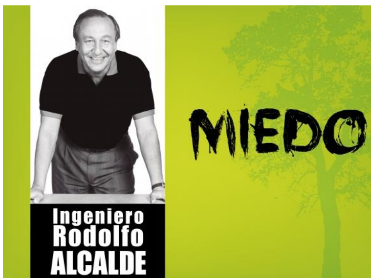
Imagen 5. Imagen del texto “Miedo” (Lógica- Ética- Estética, 2015. Disponible en: www.logicaeticayestetica.com/post/miedo/176 )

Esta descripción sería incompleta sin la revisión de la imagen que acompaña al discurso, que contiene otros elementos persuasivos. (Véase imagen 5).