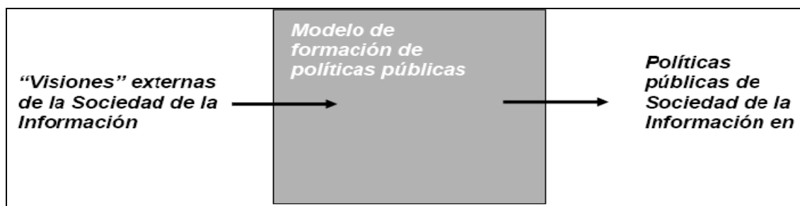
Gráfico 4. Modelo analítico de la Sociedad de la Información en Corea 7

En resumen, el concepto de Sociedad de la Información está compuesto por un conjunto heterogéneo de elementos que están de un modo u otro presentes en todas las instancias del mismo, tecnología, educación, sociedad, etc. Este esquema conceptual es capaz de recoger de forma general los diferentes filtros por los que ha de pasar el concepto de