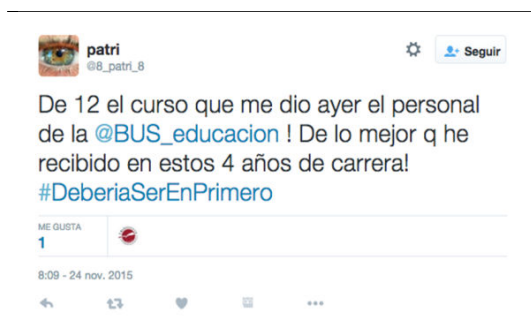
Figura 5. Tuit de un alumno durante el curso de @BUS_educacion