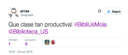
Figura 3. Tuit de un alumno durante el curso de @BUSEconomicas

Los resultados obtenidos han dependido en gran medida de que el profesor se implicara en la formación, ya que cuando esto sucedía los alumnos estaban atentos y participativos, tuiteando la clase.