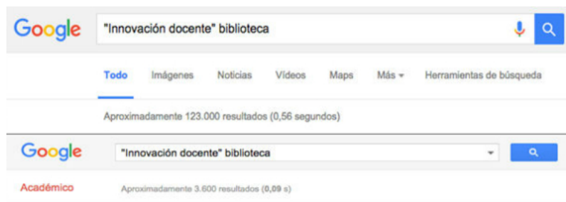
Figura 1. Resultados en Google y Google Académico tras la búsqueda de "Innovación docente' biblioteca"

Por otro lado, los proyectos de innovación docente son iniciativas de mejora de los métodos, procesos y resultados de la enseñanza-aprendizaje que tienen en cuenta las necesidades y el contexto en el que se encuentra. Gran parte de los proyectos de innovación que se presentan y ponen en marcha en las universidades cuentan con la participación de la biblioteca en mayor o menor grado. Muchos de ellos se vinculan al uso de los recursos de información y sobre todo a la formación en competencias de gestión de la información de los alumnos, por lo que la presencia de la biblioteca se vuelve imprescindible. Tan solo hay que buscar en Google o Google Académico por "innovación docente' biblioteca" y los resultados son abrumadores.