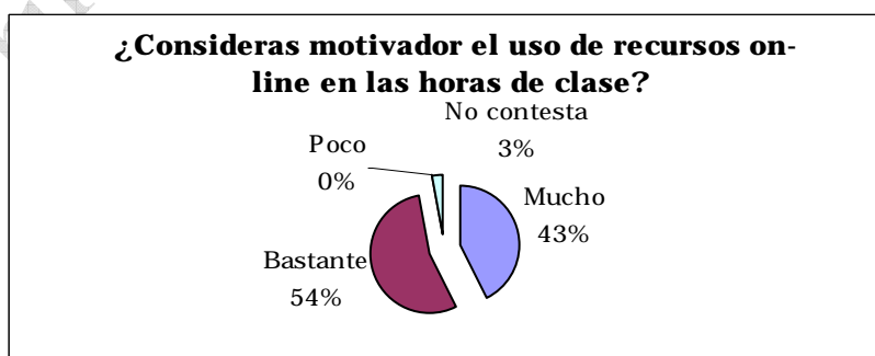
Gráfico 3. Poder motivador de los recursos on-line en el aula según el alumnado.