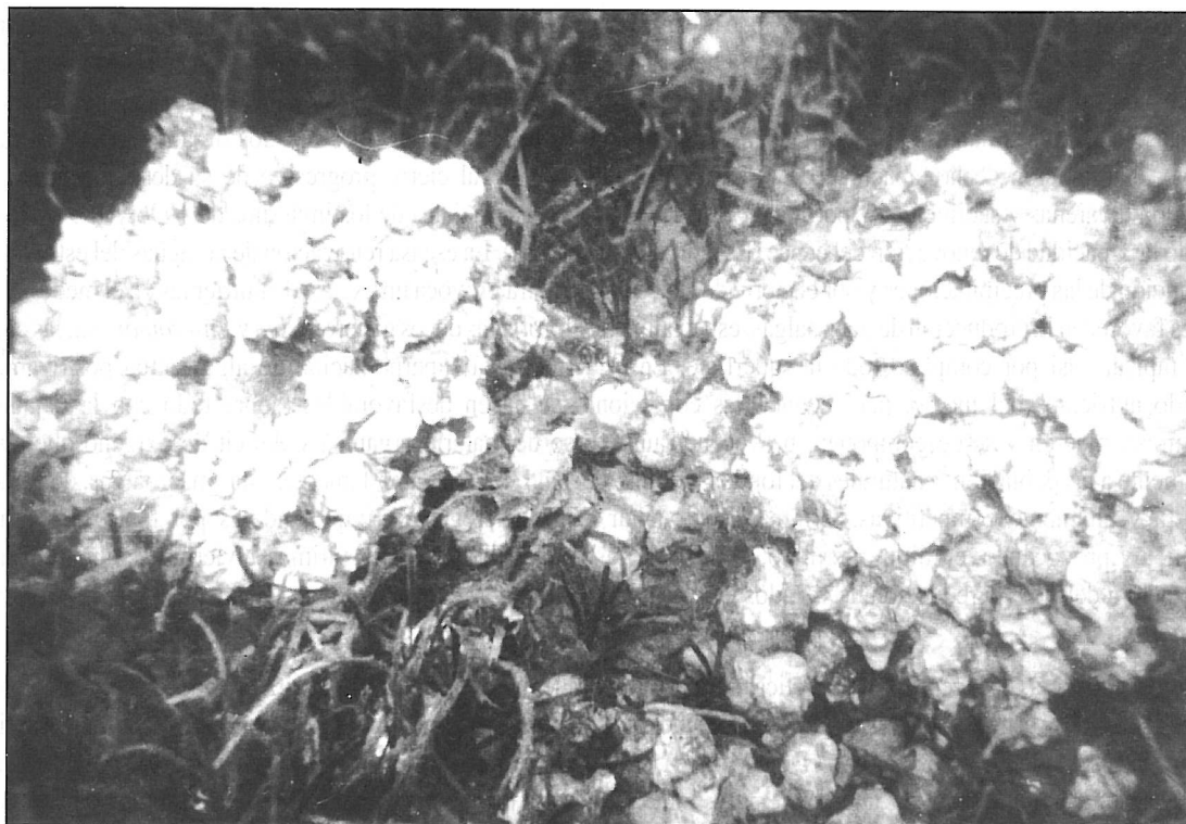
Fondos de la fanerógama Cymodocea nodosa (porreo) donde se observa la gran aglomeración del molusco Trunculariopsis trunculus (busano). Imagen tomada en las proximidades de Los Rocadillos (Guadarranque) a finales de los años 60.

Aparte de sepultamientos directos de los llamados comúnmente “algueros”, una obra que marcó el declive final de la pradera fue la construcción del astillero de Crinavis durante mediados de los años setenta. Además de sepultar el mayor roquedo natural existente en la zona interna de la bahía donde era notable la alta riqueza de fauna y flora, el material utilizado para el relleno fueron grandes piedras con una alta cantidad de material fino en su superficie. Este material fino se resuspendió y creó una gran lengua de turbidez que se mantuvo durante varios meses e impidió posiblemente la fotosíntesis provocando la muerte de las plantas. Con la pérdida de las plantas, el sedimento no es retenido por los rizomas y raíces y puede sufrir resuspensión y transporte por la acción de las corrientes y oleaje. Esto tiene dos consecuencias: por un lado, esta resuspensión provoca un incremento de la turbidez que impide la fotosíntesis de plantas cercanas a la zona impactada, generándose un especie de reacción en cadena de destrucción de la pradera, como ha podido constatarse en otras áreas geográficas (Bulthuis et al , 1984); y por otro, el sedimento sobre el que se desarrollan estas plantas suele ser de características reductoras, de tal forma que una vez que ha sido resuspendido pierde estas propiedades y, por tanto, deja de ser idóneo para un posible reestablecimiento de la pradera una vez se hayan mitigado los efectos directos del impacto.