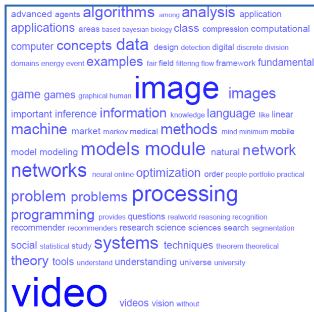
Figura 3. Tag cloud de los cursos pertenecientes a 'Artificial Intelligence'.

En consonancia con la clasificación obtenida previamente, los cursos del área 'Software Engineering' afrontan esencialmente la perspectiva de la programación. Pero se observa un interés creciente en las aplicaciones para móviles en general y Android en particular, las aplicaciones en la nube y la gestión de datos.