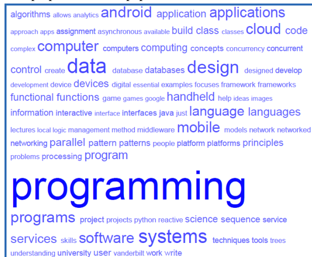
Figura 2. Tag cloud de los cursos pertenecientes a 'Software Engineering'.

cada una de las áreas consideradas, Figura 2 y Figura 3. La nube de etiquetas es una lista de etiquetas populares que se muestran por orden alfabético, con un tamaño de letra proporcional a su popularidad.