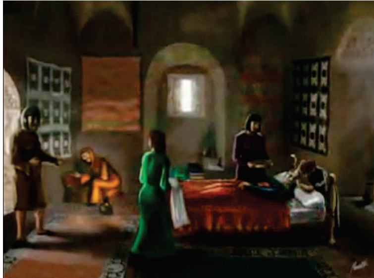
Fig. 4. Presentación del trabajo sobre el ritual funerario judío