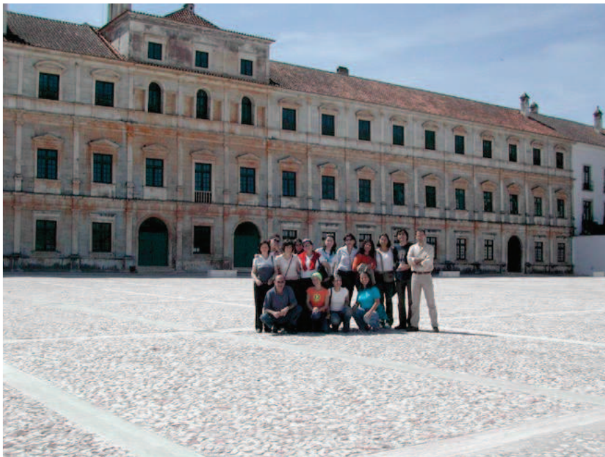
Fig. 1. Ejecución de la ruta cultural propuesta por los alumnos del grupo Maloma Excursiones