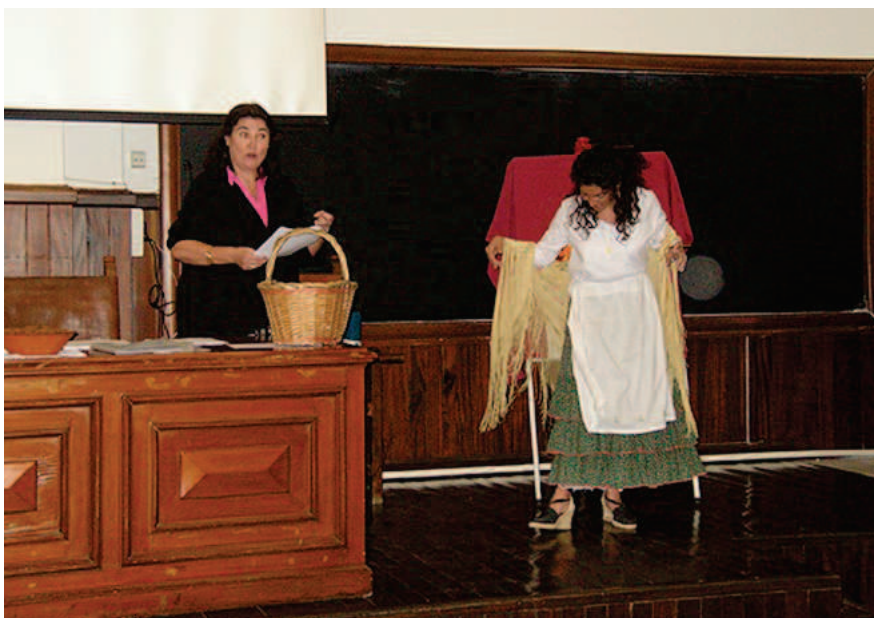
Fig. 2. Presentación de trabajo en clase