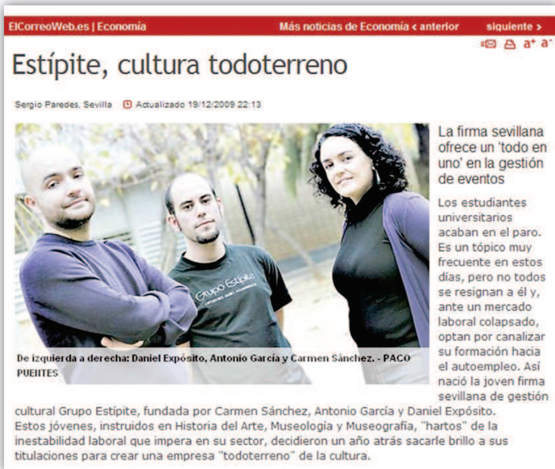
Fig. 6. Entrevista al Grupo Estípite, compuesta por exalumnos del proyecto de innovación docente ( http://www.elcorreoweb.es/economia/078848/estipite/cultura/todoterreno/gestion/eventos )