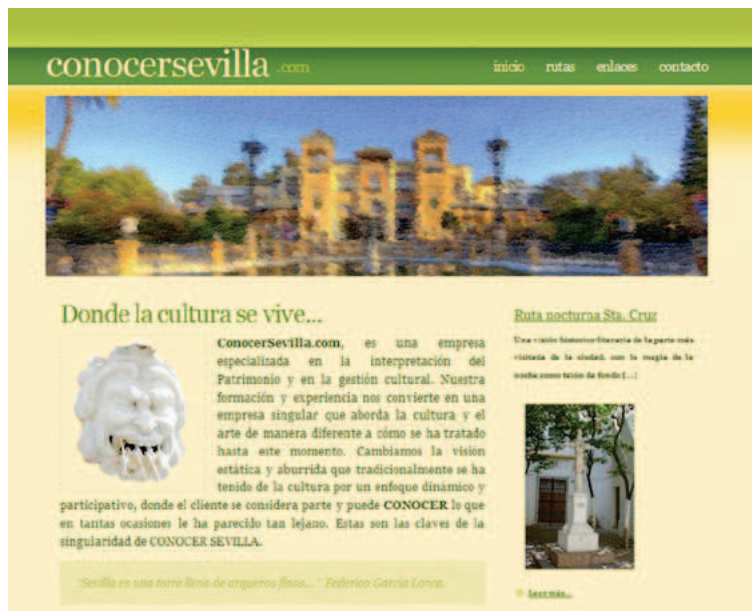
Fig. 5. Página Web de la empresa Conocer Sevilla, creada por un grupo de exalumnos del proyecto de innovación docente