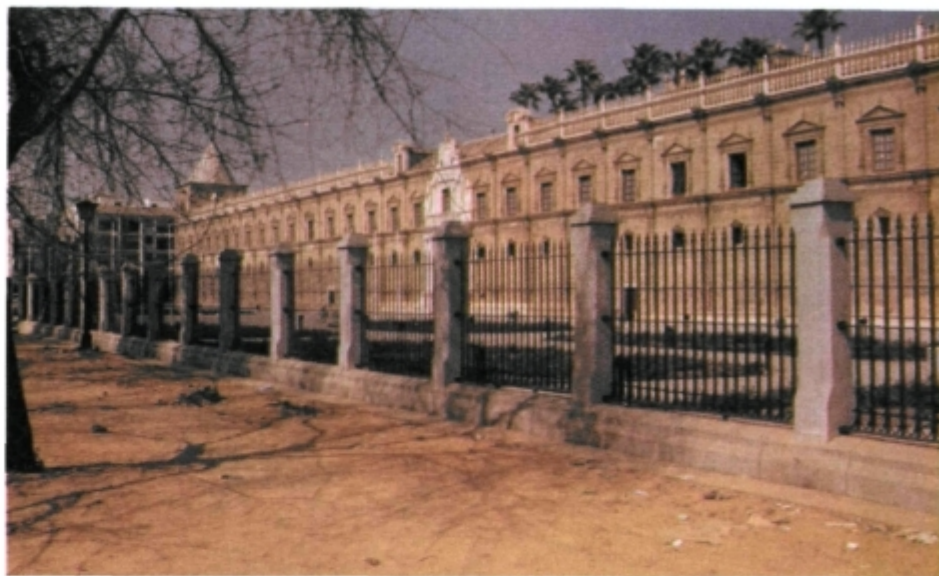
El Hospital de las Cinco Llagas recuperado como Parlamento regional para 1992.

pero conceptualmente —desde nuestra modestia— muy adecuado para iluminar esa trayectoria que deseamos. Italo Calvino (14) concibió seis conferencias en 1984, que nunca pudieron impartirse por la muerte de su autor, incluso de la última no se halló manuscrito, como afortunadamente para las restantes.