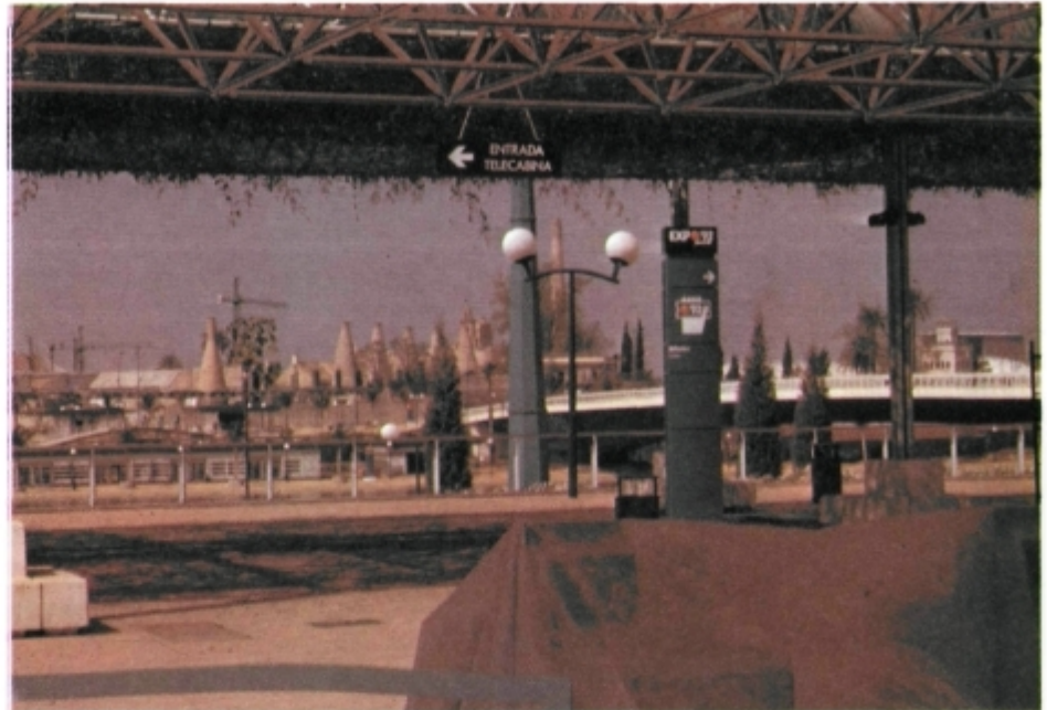
El impresionante auditorio al aire libre de la Exposición: Escena y espectáculo.

te duplicada efectivamente en Sevilla (24.000 camas, más el alquiler de casas o habitaciones «ad hoc») y donde en un radio de una hora al epicentro del evento se pueden contabilizar cien mil plazas turísticas. Más bien evocar el concepto descubrimiento en relación al fenómeno turístico.