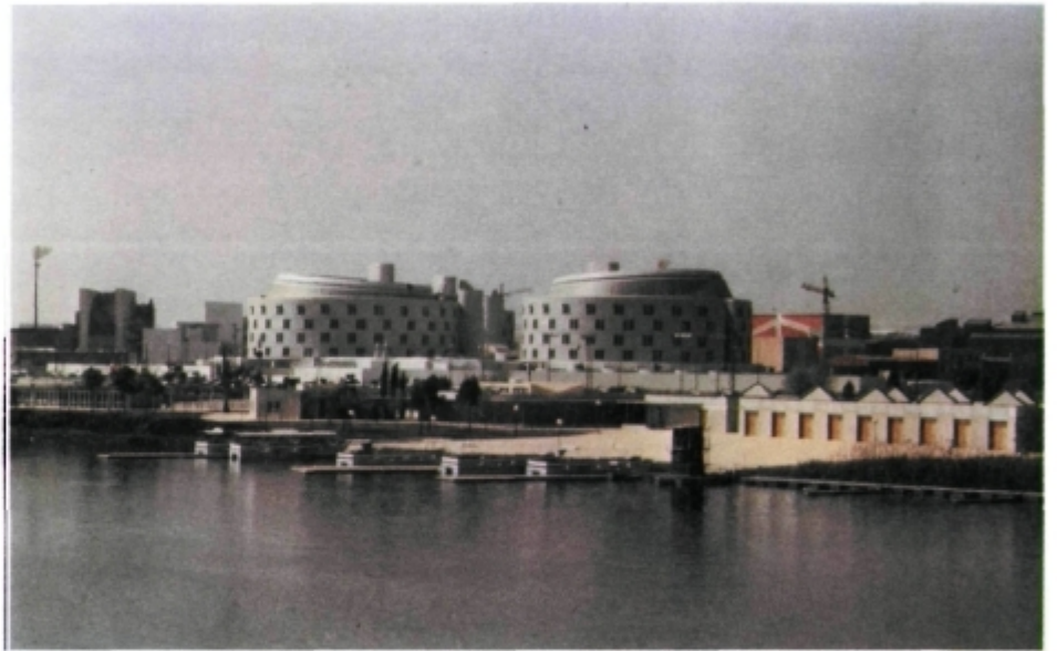
El Guadalquivir recuperado por la ciudad por mor de la Expo'92.

y comercializar concisa y exactamente lo que se vende. El peor negocio turístico será aquel que malgaste su capital humano y natural en un desarrollo no sostenible y basado en la infidelidad de la demanda. El remedio para estas patologías es el de la especialización y diversificación del producto, su diferenciación cualificada.