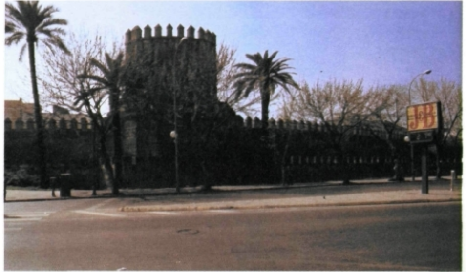
La imagen tradicional de Sevilla cercana a la Exposición Universal: lienzo de muralla de la Macarena.

Por ello, nuestra disgresión, que parte de la oportunidad de relacionar el binomio turismo/descubrimiento por mor del acontecimiento Exposición Universal de Sevilla de 1992, va a invertir sus argumentos, para, primero, examinar la articulación entre descubrimiento turístico y cultura de masas; luego, intentaremos acercarnos a las claves actuales de las relaciones emisores y receptores en lo que hemos denominado descubrimiento turístico del destino, y aterrizar definitivamente en el caso: Expo'92. El discurso se ubicará en una perspectiva pretenciosa de descubrir lo que viene, más que lo que hubo en turismo; sin desdeñarse, como se ha dicho, el enfoque cultural del fenómeno.