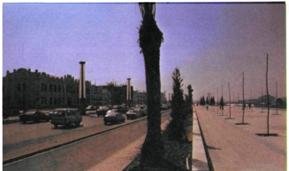
Entrada a la Expo'92 por puente peatonal y telecabina. Al fondo, el Pabellón Real (antiguo Monasterio Cartuja).

Así es, las nuevas motivaciones de la demanda se ratifican en descubrir los aspectos particulares del territorio que permanecen inmutables al consumo planetario o las pautas estandarizadas de la sociedad industrial. El turismo podría ser valedor de las culturas del propio país frente a la homogeneización. Bien es cierto que el turismo convencional ha actuado de forma contraria, hoy el turista es otro y las necesidades de descentralización cultural también.