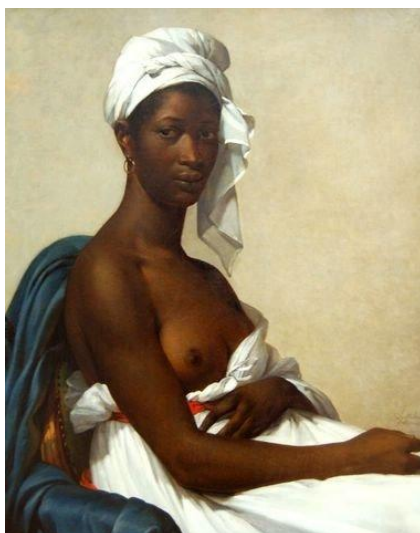
Figura 9. MARIE-GUILLEUME BENOITS. Retrato de una negra .