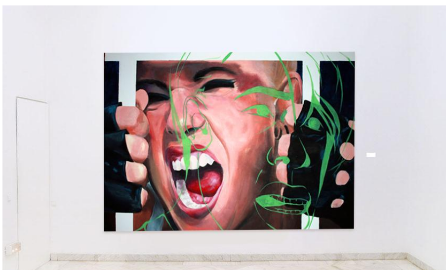
figura 17. GALERÍA FERNANDO PRADILLA. Vista sala principal (2).

Frontal junto al pasillo y lado derecho. Planta baja