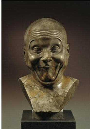
Figura 12. FRANZ XAVER MESSERSCHMIDT. An intentional Wag .

Gypsum Alabaster. 42 x 31,5 x 22,7 cm. 1770