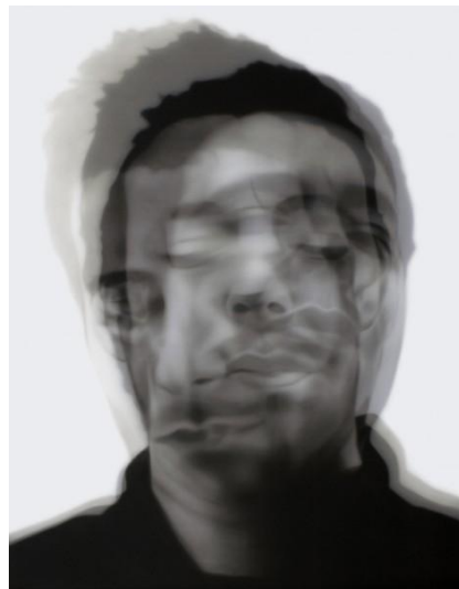
Figura 14. SERGIO LUNA LOZANO. Vertiginoso .

Hay artistas que tratan la desfragmentación del rostro o retrato múltiple donde ocultan el “yo” de la sociedad y el “yo” real como el artista Sergio Luna Lozano (1979, Murcia). El artista dice que sus series Bipolar (2009) y Composites (2010) aunque parten de un mismo pretexto, hay alguna diferencia entre ambas. En estas obras se entiende una secuencia de tiempo condensada, donde todos los fotogramas se superponen uno sobre otro, creando imágenes fantasmales, entre lo bello y lo abyecto. Pero, además, se plantea otra cuestión que supone uno de los ejes principales del trabajo de Sergio Luna, y es la incapacidad de ver las imágenes tal como son. Es decir, estas obras están compuestas por diferentes imágenes independientes, que al superponerlas crean una nueva realidad, pero que nos imposibilita poder descifrar cada imagen por separado, aludiendo metafóricamente al hecho de que las cosas no son lo que parecen, ni siquiera el propio rostro. Lo que queda reflejado en su serie Bipolar donde plasma la dualidad, representando dobles retratos con diferentes actitudes en un mismo soporte. Éste tipo de recurso ha sido utilizado también para la serie litográfica Multiserial (véase pag.10).