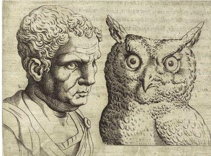
Figura 13. GIAMBATTISTA DELLA PORTA. Un búho-cara de hombre.

Grabado al aguafuerte. 14,13x 10,38 cm. 1585