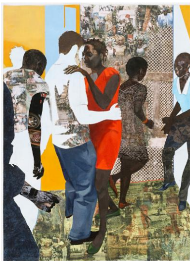
Figura 10. NJIDEKA AKUNYILI. Efulufu – The lost one .

Quizás cabe destacar a una artista nigeriana, Njideka Akunyili (1983) en sus cuadros plasma la ciudad natal donde ha vivido sus habitantes y sin dar importancia a uno en particular.