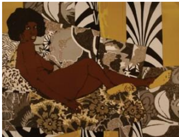
Figura 11. MICKALENE THOMAS. A Little Taste Outside of Love .

Otra artista que ha tratado el tema racial es Mickalene Thomas (1971). Ella representa a las mujeres afroamericanas como celebridades femeninas y tratando de idealizar las ideas de feminidad y poder. Los sujetos en las pinturas de Thomas irradian sexualidad. Se encuentran en poses provocativas se extienden a lo largo del plano del cuadro. Todo rodeado de patrones decorativos kitsch inspirados en su infancia.