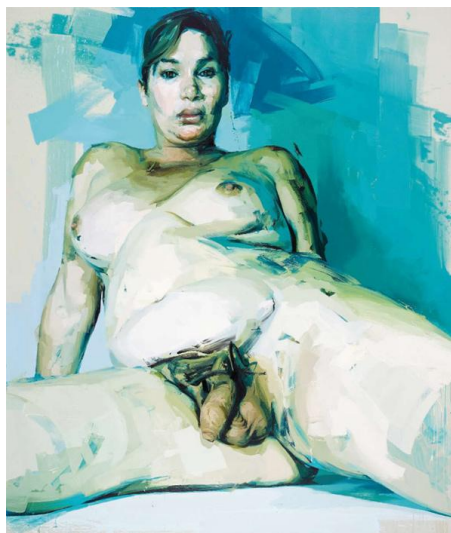
Figura 7. JENNY SAVILLE. Passage .

Otro ejemplo lo encontramos en Jenny Saville (1970, Cambridge). La cuál retrata a modelos de grandes proporciones con genitales de hombre y mujeres en diferentes cuerpos. A pesar de que sus obras pueden ser grotescas en cierto modo también muestran belleza.