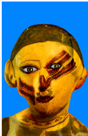
Figura 6. ORLAN. Desfiguración y refiguración. Precolombina mitad híbrido no.3

Novia de Frankenstein , con la característica línea blanca zigzagueante en su cardada melena morena. (DueñasVillamiel, 2011:35-39)