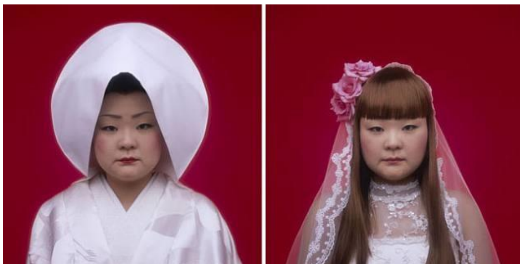
Figura 1. TOMOKO SAWADA. Bride .

La artista japonesa Tomoko Sawada (1977) vistió como 100 chicas diferentes en un fotomaton y atrajo la atención del mundo del arte para convertirse en una de las grandes inquisidoras de la identidad, los moldes sociales, las tradiciones y la individualidad. Parodia el cuestionamiento de la validez de estas normas. El hecho de que la artista pueda falsificar cualquier estereotipo demuestra ser capa de jugar con astucia al gato y al ratón poniendo de manifiesto lo absurdo del asunto y la invalidez de los estereotipos con respecto a la individualidad humana. Mostrando las complejidades que implica el buscar la individuación y al mismo tiempo hallar la validación de la pertenencia a un grupo. La japonesa trabaja las tensiones entre género y objeto, máscara y rostro, etiqueta social y estereotipo. Además Sawada también se ocupa de las hibridaciones entre la cultura juvenil, las tradiciones japonesas y los estereotipos e ideas relativos a la belleza occidental.