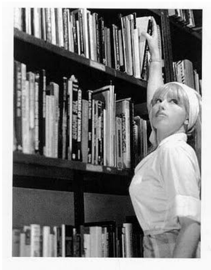
Figura 5. CINDY SHERMAN. Untitled Film Still #13 .

Otra artista que a través de su trabajo es la fotógrafa y cineasta estadounidense, Cindy Sherman. Ella reflexiona sobre los roles masculino y femenino en la sociedad que aparecen en los medios. Es conocida por sus autorretratos en donde utiliza originales disfraces para motivar la reflexión y se vale para la creación de sus personajes de la manipulación y apropiación de la estética y fotogramas de películas de cine negro clásicas.