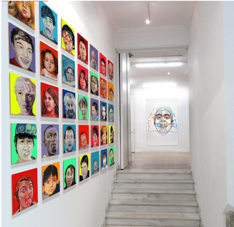
figura 19. GALERÍA FERNANDO PRADILLA. Pasillo. Planta baja