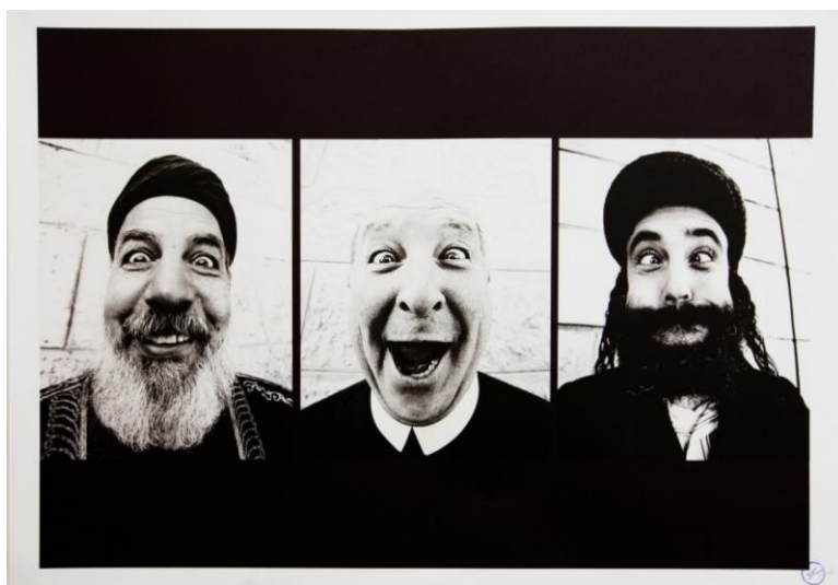
Figura 8. JR. Face2Face .

El artista francés conocido como JR (1983) muestra en su proyecto Face to Face (2007) cómo los ciudadanos de Palestina e Israelí son incapaces de diferenciar quienes son cada uno ya que el propio artista decidió colocar a los palestinos en un muro israelita y a los israelíes en palestina frente a frente.