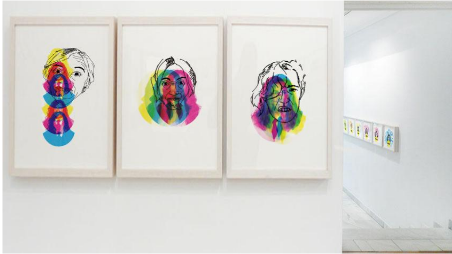
figura 18. GALERÍA FERNANDO PRADILLA. Vista sala principal (3).