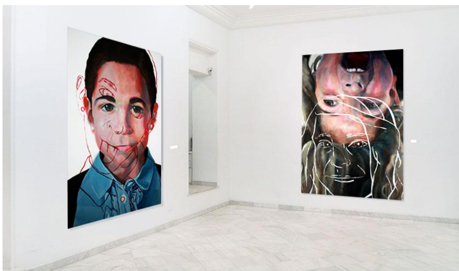
figura 16. GALERÍA FERNANDO PRADILLA. Vista sala principal (1).

Frontal junto al pasillo y lado derecho. Planta baja