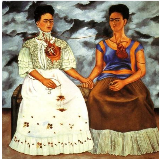
Figura 2. FRIDA KHALO. Las Dos Fridas .

Artemisia Gentileschi, Hilma af Klint, Camille Claudel y Frida Kahlo. Ésta última, es una pintora mexicana que se caracteriza por los elementos expresionistas y surrealistas con temática popular y autobiográfica, que hacen únicas sus obras. Encarnó un nuevo tipo de mujer: autosuficiente, fuerte y de características sexuales andróginas y es más, adoptó actitudes y rasgos varoniles. Se representó en su obra con un físico fuertemente ambiguo con algunos rasgos masculinos exagerados como eran sus cejas y su bigote.