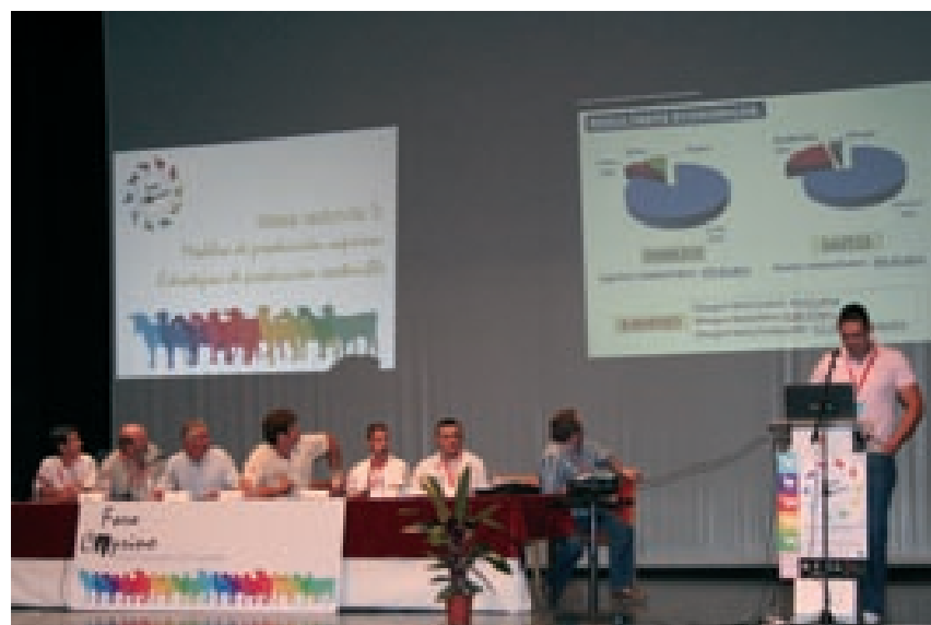
II Foro Nacional de Caprino-Mesa - Modelos de producción caprina: estrategias de producción sostenible.

Entre las causas que a finales de 2007 provocaron el incremento del precio de los alimentos para el ganado, están el uso de alimentos para la producción de biocombustibles, la obtención de malas cosechas en algunas áreas del planeta y la especulación de los mercados. Aunque las empresas lácteas aumentaron también el precio de la leche, no lo hicieron en la misma proporción que el precio de los alimentos. En 2009 el precio de los ali-