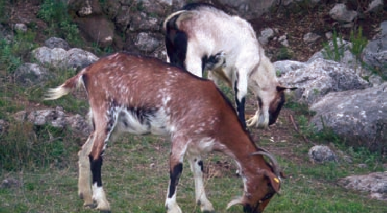
Animales de la raza Payoya en pastoreo.