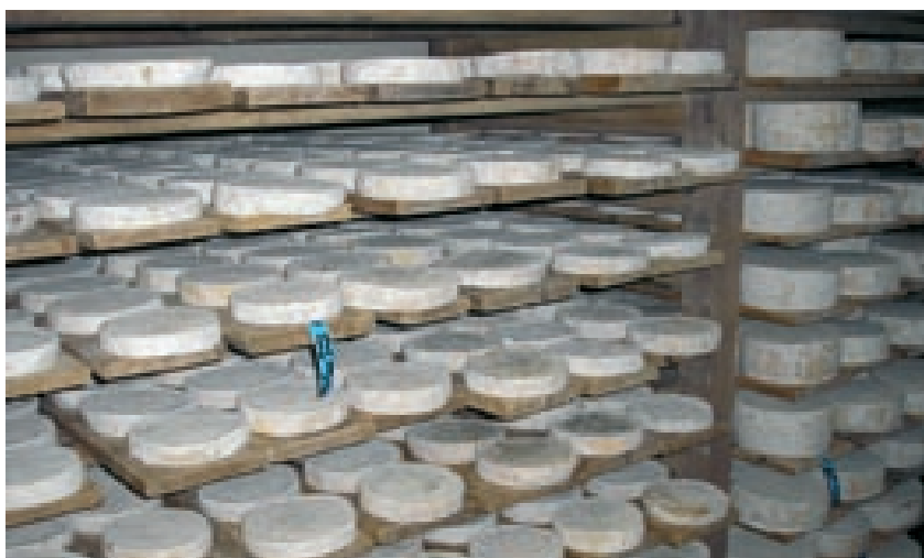
Cámara de maduración - quesería "fermier" francesa.

La mejora genética de las cabras supone, sin duda, un beneficio para la explotación, tanto por el aumento de productividad de las cabras, como por la posibilidad de obtener ingresos por la venta de animales vivos para reposición. El aumento de la producción por cabra y año debido a la mejora genética se consigue, en gran medida, gracias a la herramienta que brinda el control lechero. La posibilidad de tener la producción individualizada de cada animal hace que animales con producción por debajo de