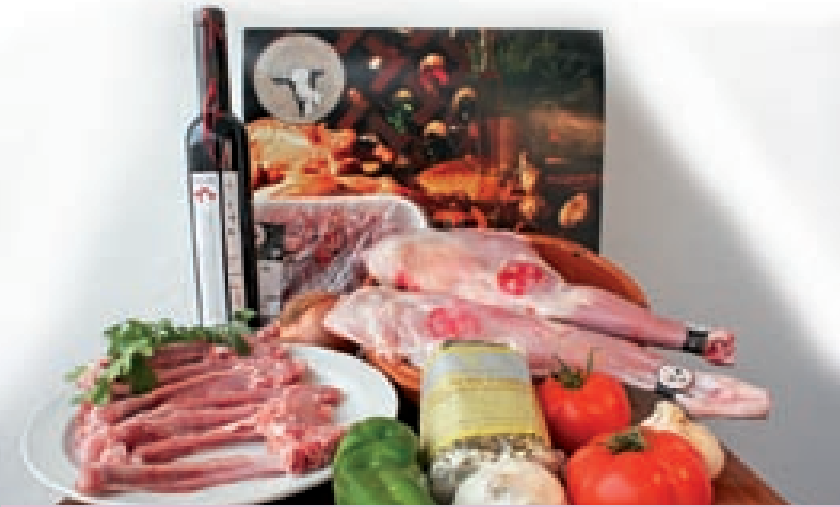
Comercialización de productos de la cabra de raza Malagueña.

2%; otras utilizan la media de los últimos 3 años y otras no han impuesto ningún límite. En los casos en que existe límite, si el ganadero sobrepasa el margen impuesto se le penaliza bajándole el precio del litro de leche.