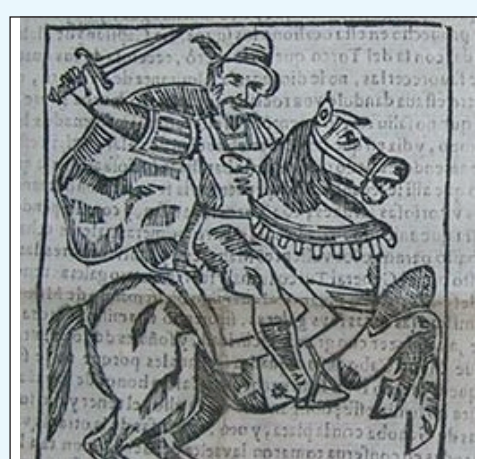
ILUSTRACIÓN 2. Imagen de la segunda relación.