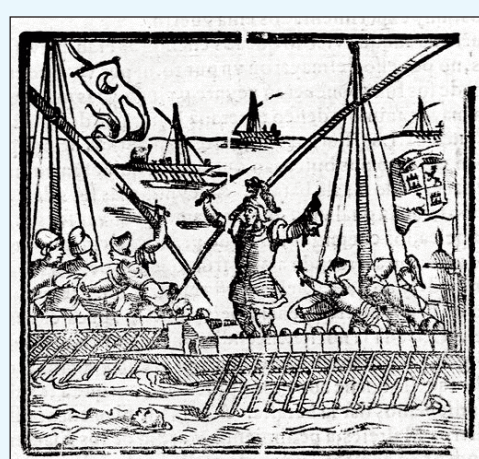
ILUSTRACIÓN 1. Imagen de la primera relación.