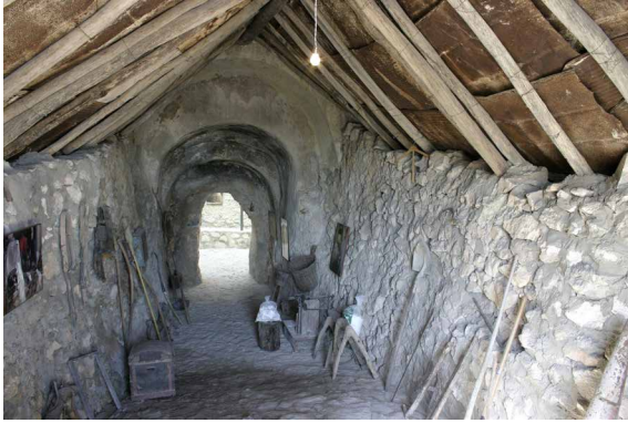
Vista del pecho del Horno Escudero.