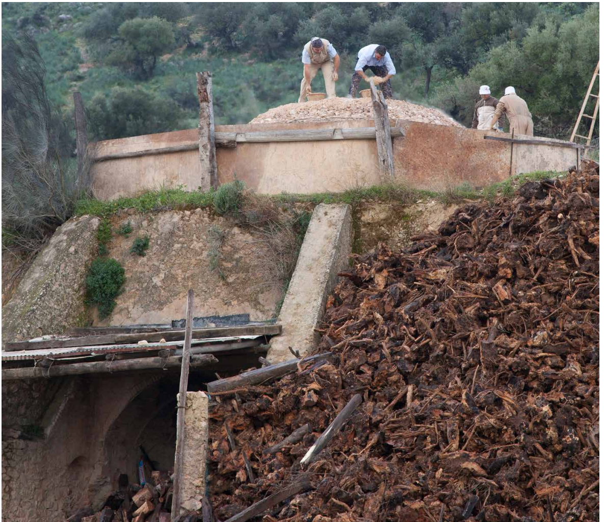
Horno en funcionamiento en la fábrica Gordillo's Cal de Morón.