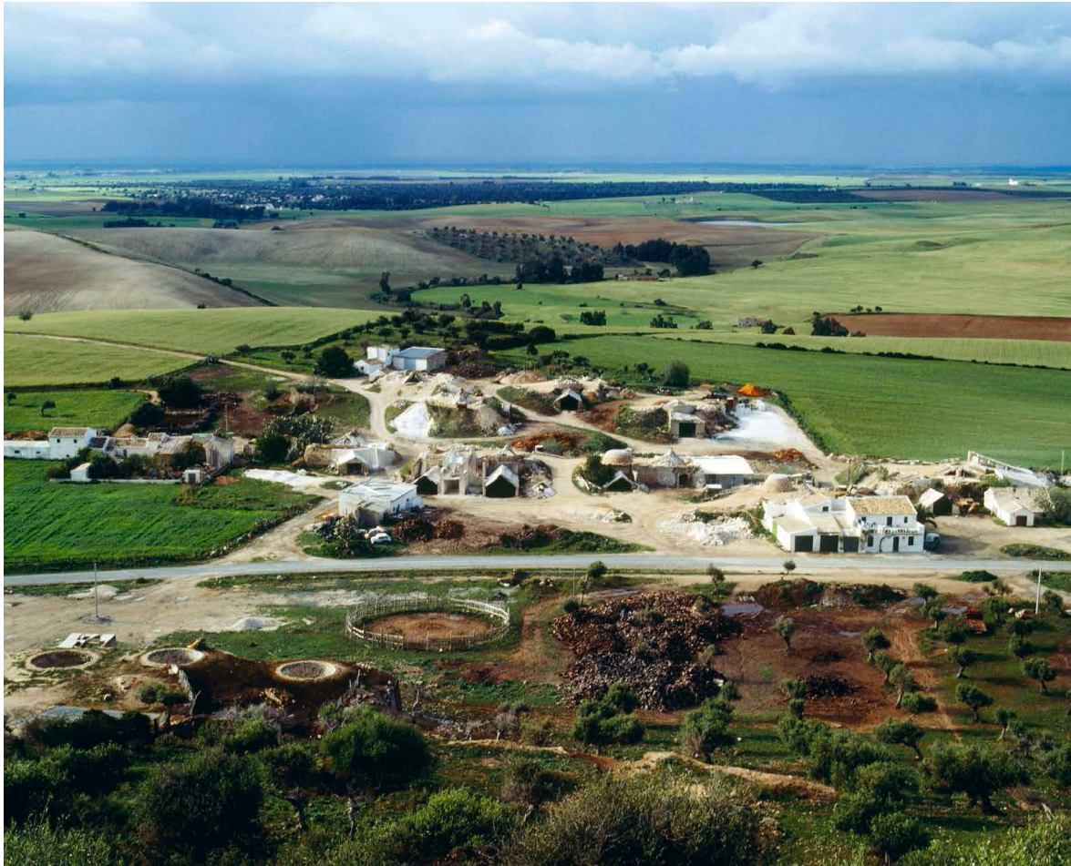
Vista general del poblado de Las Caleras de la Sierra.

En el ámbito de la construcción arquitectónica, la cal es un material muy versátil. Por un lado, como conglomerante, mejora la resistencia del hormigón para cimentación, de morteros de agarre o de acabado y permite obtener pinturas o enlucidos decorativos. Por otra parte, la cal proporciona al producto final, buena resistencia mecánica, muy adecuada respuesta frente a la durabilidad y una plasticidad muy beneficiosa frente a los efectos de absorción hídrica, dilatación y retracción. Además, permite la regulación del vapor de agua entre la base soporte, el revestimiento y el entorno, garantizando una mejor respuesta del muro frente a la humedad y una óptima calidad ambiental en locales interiores.