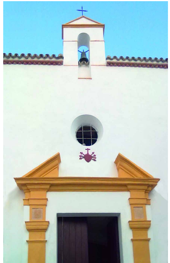
Vista fachada e interior de la ermita San Antonio Abad.

La Ermita de San Antonio Abad está situada en el barrio alto de la localidad de Arcos de la Frontera (Cádiz) y forma parte del casco antiguo de la ciudad. El edificio datado en el s. XV,