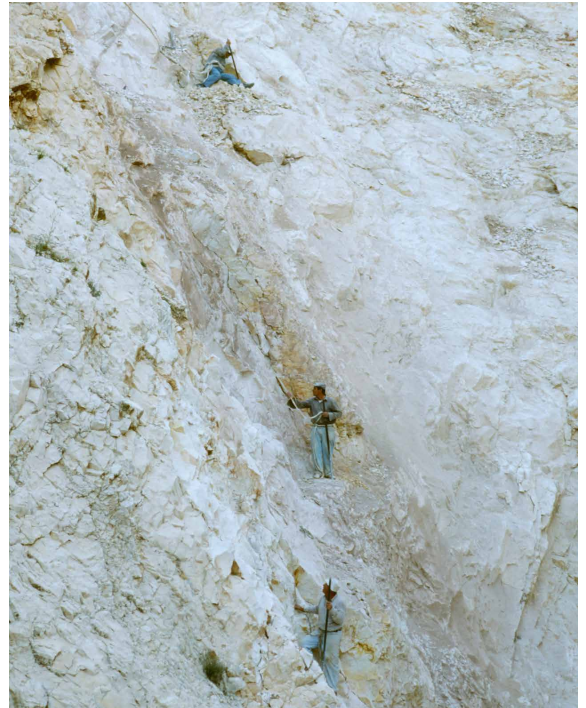
Cantera de piedra caliza durante el proceso de extracción.

Este Museo consta de una sala de proyecciones y oficinas administrativas, dos hornos tradicionales de elaboración de cal (datados del s. XIX y totalmente restaurados) y una pequeña casa denominada casilla del calero, emplazados en una superficie aproximada de 3000 m 2 . El espacio exterior se utiliza como centro de interpretación al aire libre donde los propios caleros exhiben el proceso de la elaboración artesanal de la cal y su influencia en la cultura andaluza.