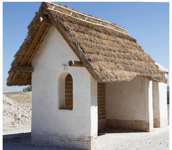
Vista del proceso de ejecución de la parada de autobús.

a seguir en función de los problemas o lesiones que aparecen en una obra. La vegetación autóctona (básicamente enneas, cañas y castañeras) se emplearon para la ejecución de la cubierta vegetal 13 .