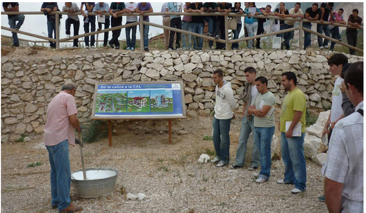
Proceso de apagado de la cal, guiado por los caleros.