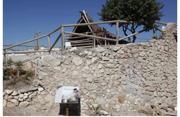
Vista de la protección superior del Horno Gordillo.