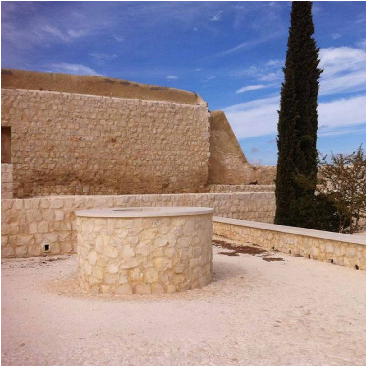
Vista general del recinto del Alcázar de Estepa.

La producción, promoción y difusión de la versatilidad de la cal artesanal está avalada por su aplicación en las intervenciones arquitectónicas, tanto patrimoniales como en obra de nueva planta. Consecuentemente, se seleccionan tres edificaciones representativas de diferentes contextos y programas de necesidades, que permiten mostrar la versatilidad y adaptabilidad de su empleo. Así, se refleja su uso como material para la consolidación estructural, como material de acabado en una restauración y como único conglomerante en una obra nueva.