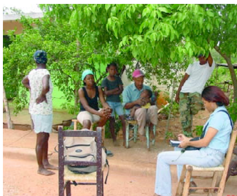
FIGURAS 2 Y 3.

sus centros básicos de salud, por ser aquellas en las que el recurso plantas medicinales tiene una mayor importancia en datos absolutos y relativos a los habitantes en cada sección.