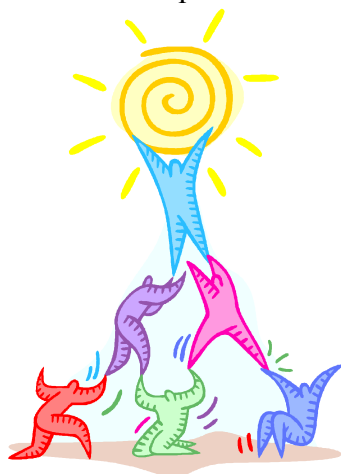
Figura 2: ¿Los profesores en la base y los alumnos en la cumbre?

En definitiva, han surgido circunstancias nuevas que nos obligan a reflexionar sobre los fines de la enseñanza universitaria, sobre las metodologías a emplear y en especial, sobre los papeles que el profesor y los alumnos deben desempeñar en la Universidad para conseguir un aprendizaje de calidad por parte de nuestro alumnado. ¿Deben estos papeles ser revisados? ¿Deben formar los estudiantes y el profesor un verdadero equipo que aúpen al estudiante a alcanzar la meta? Y si es así, ¿cuál debe ser esa meta? ¿el conocimiento o, como se dice ahora, la adquisición de competencias? En nuestra opinión, ambos. Eso sí, no se trata de un conocimiento estático y abstracto sino de un conocimiento absolutamente dinámico que les sea útil en la vida aunque las circunstancias cambien, como es inevitable que ocurra.