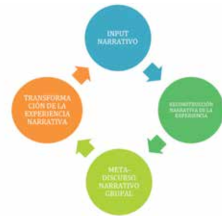
Fig. 1. Desarrollo de las sesiones

Así, cada sesión comienza con un input diferente según el código discursivo que se trabaja (metáforas, imágenes, escritura o cuerpo). A través de cada código discursivo se ofrece a los estudiantes la posibilidad de reflexionar sobre su experiencia en la universidad, en ocasiones, desde una perspectiva sincrónica, focalizada en puntos temporales concretos (por ejemplo, los exámenes), y en otras ocasiones desde un enfoque diacrónico, que implica recorrer toda la experiencia académica. A partir de este estímulo, el estudiante reconstruye su experiencia a nivel individual y después a nivel colectivo por medio del debate grupal y el contraste de experiencias. El circuito metodológico se repite en cada módulo con un progresivo nivel de profundidad. Para apoyar este proceso existe un Dossier de materiales para el estudiante (FREDA, 2014).