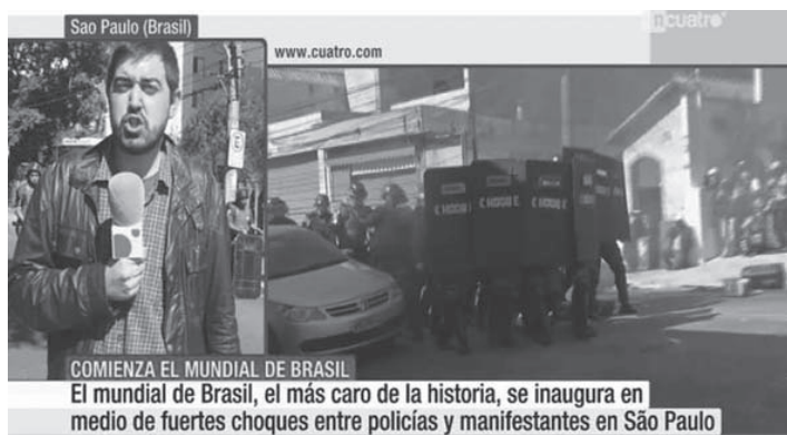
Imagen 8 – Imagen inicial y final del informativo de Cuatro