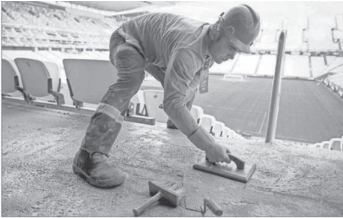
Un trabajador echa cemento en una de las tribunas del estadio Arena Corinthians de São Paulo.