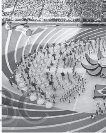
La gran fiesta en el Corinthians Arena de Sao Paulo