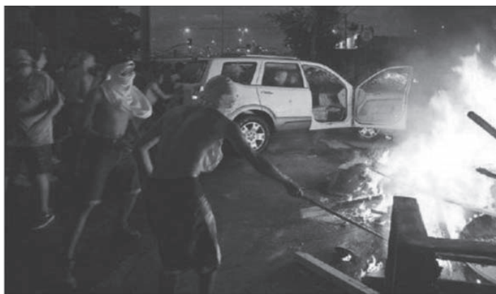
Imagen 3 – El País 27/06/2013

En la edición electrónica de El País del 12 de junio se señalaba: “Brasil, poco acostumbrado a protestar en la calle, esta vez se ha levantado en las principales ciudades del país contra el aumento de los pasajes del transporte público” (2013). Días posteriores en plena fase final del torneo de la Confederaciones el rotativo español abriría su sección internacional del día 27 de junio con una cobertura especial sobre las manifestaciones que estaban aconteciendo esos días en Brasil (v. Imagen 3). De este modo, se empieza a percibir una actitud menos conformista de la población, desencantada con las medidas del gobierno presidido por Dilma Rouseff. Así, se pasa del protagonismo de la información deportiva a una cobertura periodística más centrada en otro tipo de aspectos.