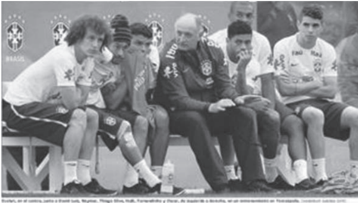
Imagen 11 – Portada sección deportes El País 3/07/2014