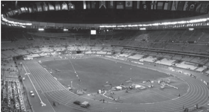
Imagen 1 – Estadio de la Cartuja de Sevilla

de Sevilla 4 . Y será con la concesión de la candidatura para la celebración del VII Campeonato mundial de atletismo de 1999, la que permitió construir una mega instalación con capacidad para 60.000 espectadores y con un coste de 120 millones de euros (de los que gran parte procedía de subvenciones públicas). A pesar de que el Mundial de atletismo no requería una instalación tan colosal, se planificó con idea de que una vez terminara el evento atlético se trasladasen los dos equipos de fútbol de la ciudad, Sevilla F.C. y el Real Betis, a través del uso alternado del recinto tomando como modelo algunos estadios italianos. Sin embargo, el rechazo de los aficionados de ambos clubes a trasladar su sede compartiendo el mismo espacio, paralizó la garantía de un uso regular de la instalación así como de su mantenimiento. Como resultado, se ha generado un espacio multiusos con irregular uso deportivo (algunos partidos de fútbol) que ha dado paso a albergar multitudinarios conciertos de música o inclusive certámenes de carácter religioso.