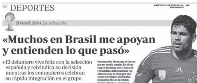
Imagen 10 – Diego Costa en ABC 11/06/2014

Eliminado el conjunto español, la atención informativa hacia el Mundial disminuyó considerablemente debido al inesperado fracaso obtenido. Paralelamente el equipo brasileño iba avanzando con éxito en la competición si bien el juego de Scolari no convencía, mientras el entrenador gaúcho criticaba a la Fifa y hasta la propia prensa local por falta de apoyo al equipo. A las puertas de los cuartos de final y en un clima de cierta euforia, la prensa española destacaba como el pueblo brasileño parecía haber aparcado las protestas sociales de días atrás y el gran protagonista ahora era el entrenador (v. Imagen 11).