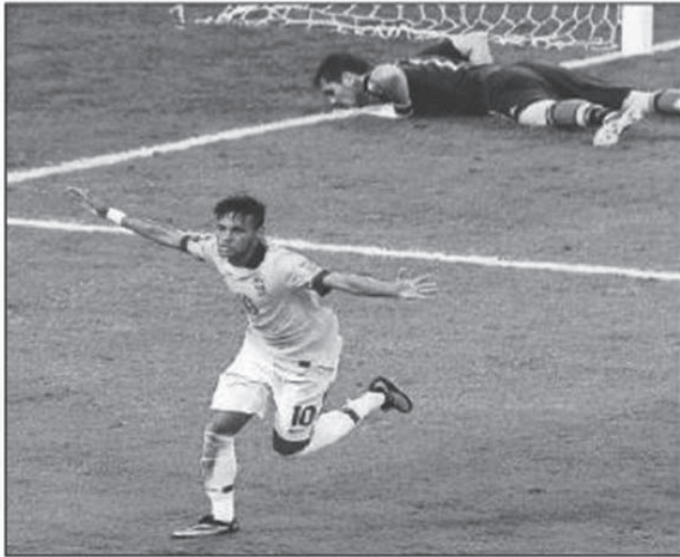
Neymar celebra el segundo gol de Brasil ante España.