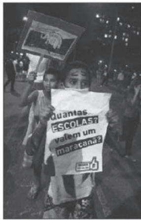
Dois mil de la favela de Rocinha protestan en Río.

Las tiendas de lujo de Leblón y los despachos de empresarios habían cerrado sus puertas ante el anuncio de que la favela "estaba bajando". Y todos fueron cogidos de sorpresa, porque aquellas gentes acostumbradas a estar aporreadas entre la violencia de los narcos y la de la policía libraron la marcha más pacífica hasta ahora de las protestas callejeras.