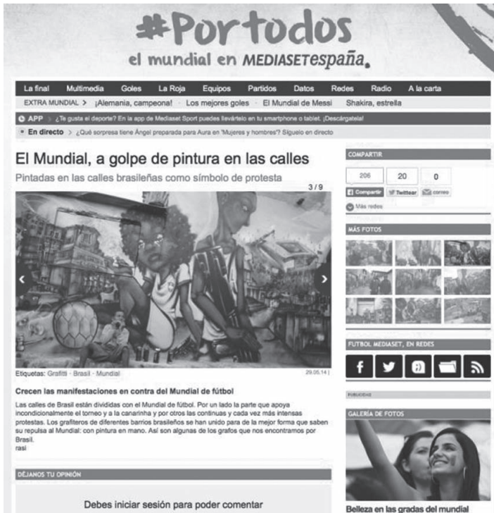
Imagen 7 – Previo a la Copa

En otro orden, minutos previos a la inauguración del evento el jueves 12 de junio, la cadena de televisión Cuatro (grupo Mediaset ) anunciaba en su informativo la situación en las calles de São Paulo en la cual el enviado especial informaba en directo como grupos antidisturbios de la policía estaban lanzando gases