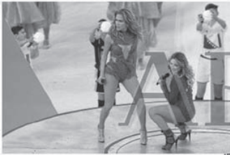
Jennifer Lopez (izquierda) y Claudia Leite en la ceremonia inaugural