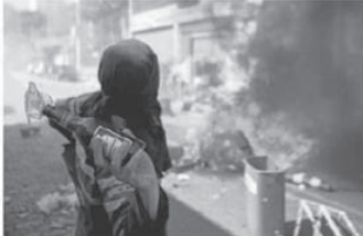
Un manifestante lanza un cóctel molotov en Sao Paulo