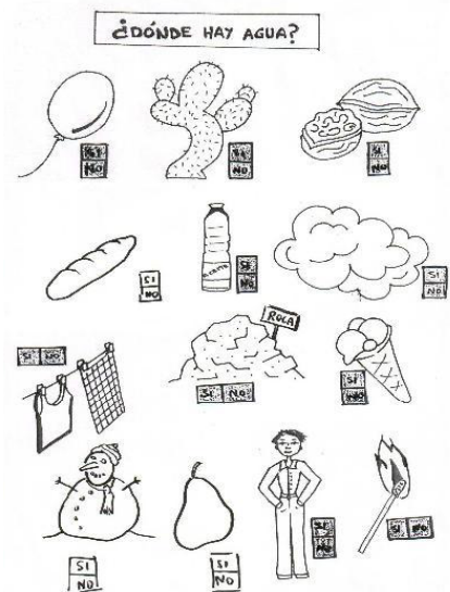
Figura 3. Actividad 6.