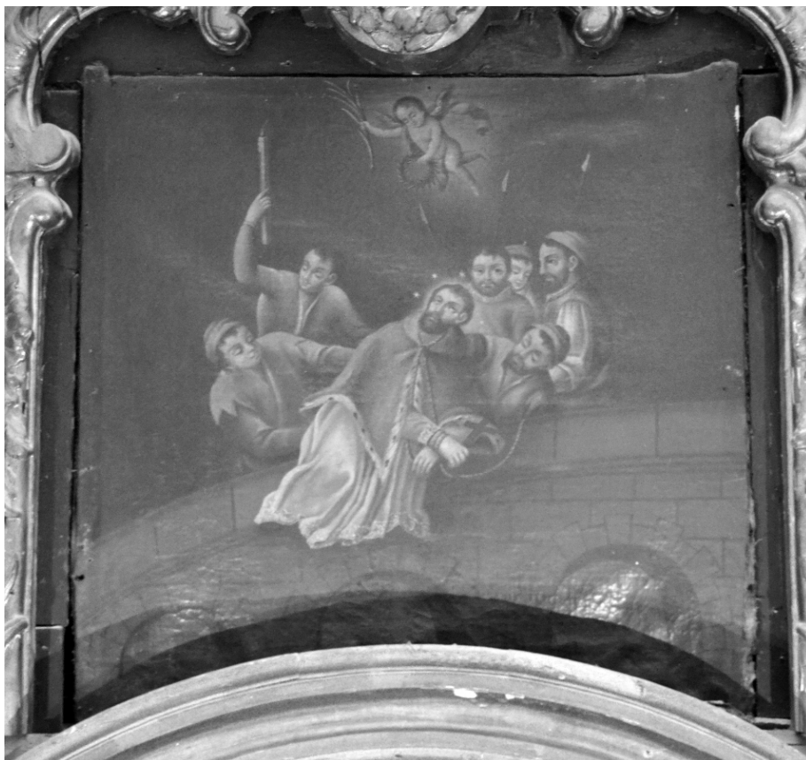
Figura 4. Anónimo sevillano. Martirio de San Juan Nepomuceno. Pintura del ático del retablo de dicho santo (1756-1757). Iglesia de Santa María la Blanca. Sevilla.