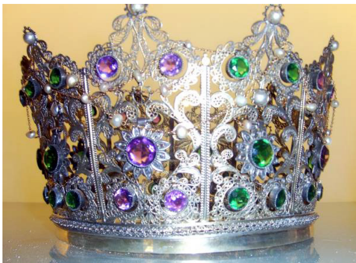
Figura 6. Manuel González de Rojas, 1889. Corona de filigrana dorada y piedras francesas de la Virgen de los Reyes (© Teresa Laguna y Catedral de Sevilla).