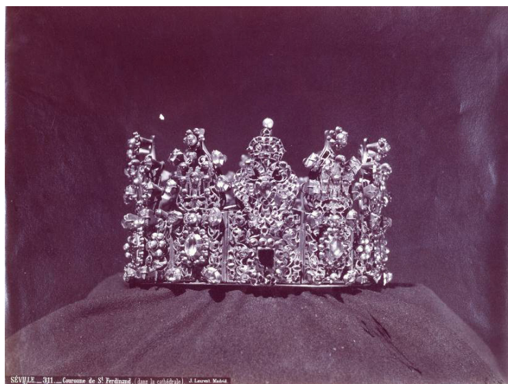
Figura 3. Corona de la Virgen de los Reyes sustraída el 1 de abril de 1873. Jean Laurent, 1872 (© Madrid, Museo Nacional de Artes Decorativas).