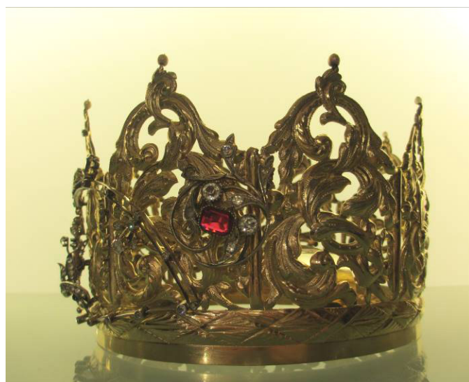
Figura 4. José Lecaroz, 1873. Corona de la Virgen de los Reyes. Catedral de Sevilla, capilla Real (© Teresa Laguna y Catedral de Sevilla).