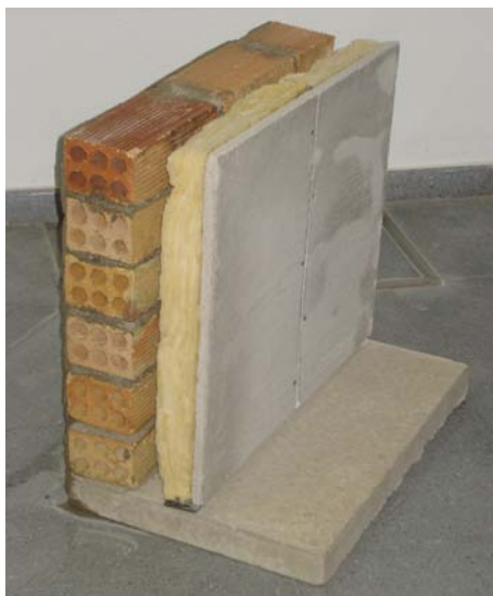
Figura 2. Prototipo de fachada con paneles de yeso reciclados (10)

Para llevar a cabo la evaluación se ha empleado como guía el Catálogo de Elementos Constructivos (CEC) del Código Técnico de Edificación (CTE) (14). De estas tres soluciones se han obtenido sus transmitancias térmicas, con el fin de conocer el grado de aislamiento térmico de estos cerramientos, y se ha comprobado que se encuentran por debajo del valor límite fijado por el CTE para la zona climática de Sevilla, la zona B4, en la cual la transmitancia térmica de muros de fachada presenta una limitación de U_{Mlim} = 0.82 \text{ W/m}^2\text{K} , tabla 1. En la solución 2 se sustituye el material comercial por paneles de yeso reciclado en la hoja interior, los resultados se muestran en la tabla 1, solución 4, que también cumple con la limitación.