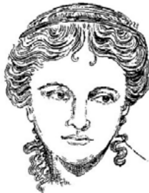
Figura 5. Hiparquia.

Hiparquia nació en la ciudad de Tracia en el siglo II a.C. y se la puede considerar como la primera mujer filósofa . Tendría 15 años cuando decidió ingresar en la escuela de los cínicos , seguramente introducida en la filosofía por su hermano Metrocles, que había sido alumno de Aristóteles en el Lyceum y más tarde seguidor de Crates. Sin embargo, su familia pertenecía a la aristocracia, por lo que se opusieron a su ingreso en la escuela cínica. Se sabe que Hiparquia se enamoró de Crates, líder de los cínicos y bastante mayor que ella, pero su familia también se opuso y quiso impedir el matrimonio, lo cual no pudo hacer cuando Hiparquia amenazó con suicidarse si no se casaba con su amado.