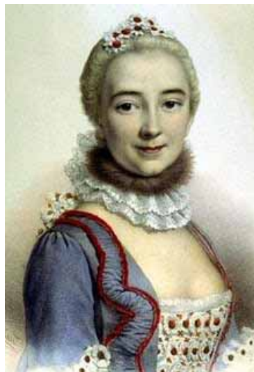
Figura 7. Gabrielle Émile Le Tonnelier de Breteuil.

Gabrielle Émile Le Tonnelier de Breteuil, nacida en París y más conocida con el nombre de Marquise de Châtelet o Madame de Châtelet, por su casamiento a los 19 años con el Marqués de Châtelet, escribió una obra, titulada Instituciones de Física , en la que criticaba algunas teorías de Newton y se inclinaba por la obra de König.