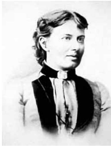
Figura 10. Sofía Kovalevskaya.