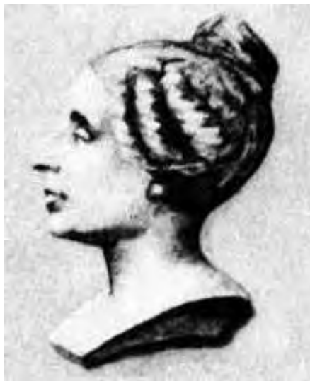
Figura 8. Marie-Sophie Germain.

Marie-Sophie nació en París, en 1776, en el seno de una familia de holgada posición económica. Sin embargo, sus padres, aun siendo personas cultas e instruidas, decidieron disuadirla de seguir una vida de estudios y continuamente la estaban invitando a que "abandonara esas costumbres y fuese pensando en casarse cuanto antes" , dado que, según ellos, "las mujeres sabias son consideradas pedantes y su probabilidad de casarse es inversamente proporcional a sus conocimientos científicos" .