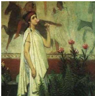
Figura 4. Mujer romana.

Las mujeres en la sociedad romana no tenían mucho poder, ya que la política estaba dominada por los hombres. La vida de la mujer romana dependía del puesto que ocupaba en la sociedad. Las mujeres de un nivel adinerado no se dedicaban a las labores cotidianas del hogar ya que tenían esclavos que se encargaban de esas tareas e incluso de dar masajes y peinar a sus dueñas. Pero pocas mujeres podían llevar una vida dedicada al ocio.