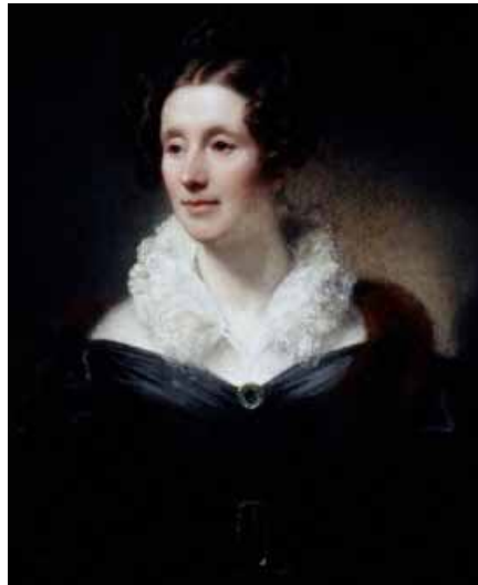
Figura 9. Mary Fairfax Greig Somerville.