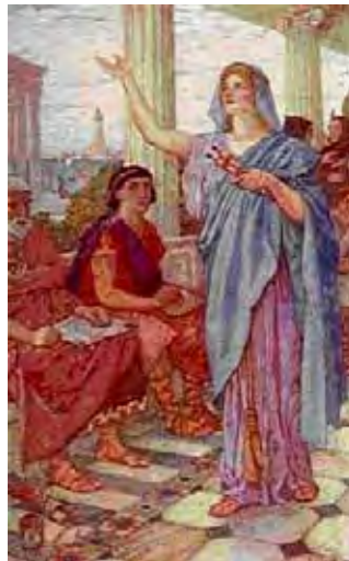
Figura 2. Mujer griega.

Desde el día del nacimiento hasta el de su muerte, una mujer de la antigua Grecia vivía bajo el control de los hombres. Su padre, sus hermanos e incluso sus hijos, tomaban decisiones que alteraban su vida. Las mujeres no podían votar ni tener un empleo público, heredar o poseer propiedades, ni siquiera comprar algo que costara más que un precio determinado. No obstante una mujer no carecía totalmente de poder: dirigía la casa y controlaba el dinero de la familia. Como se comentará posteriormente, algunos hombres importantes, como Pericles, escuchaban cuidadosamente los consejos de sus mujeres.