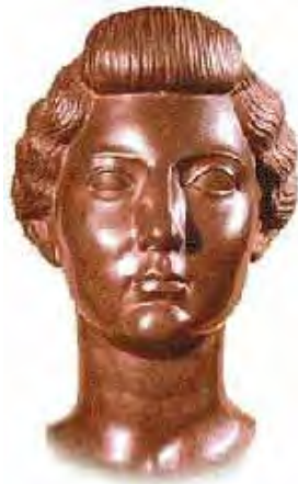
Figura 3. Mujer espartana.

En ninguna parte de Grecia las mujeres fueron más libres que en Esparta, eran las únicas que tenían acceso a participar en todos los torneos, excepto en las Olimpiadas, ya que en el resto de regiones de Grecia no les estaba permitido.