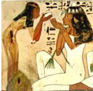
Figura 1. Mujer egipcia.

Aunque los varones y las mujeres tenían funciones bien diferenciadas en la sociedad, los egipcios reconocían a la mujer no como igual al hombre, pero sí como su complemento (aunque la propia literatura egipcia no vacila en presentar a la mujer como frívola, caprichosa y poco fiable, dado que prestaba mucha atención a su aspecto, mimando especialmente el peinado y maquillaje).