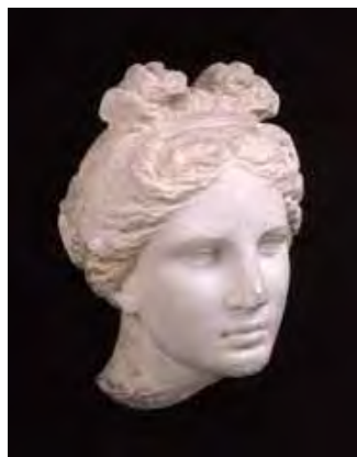
Figura 6. Agnodice.

Agnodice fue una médica ateniense que nació en el 300 a.C. Era una joven brillante que pertenecía a la alta sociedad ateniense pero que se sentía frustrada por la prohibición de que las mujeres no podían estudiar. Para salvar ese inconveniente, se cortó el pelo para parecer un varón y de esa forma acudió a Alejandría para estudiar medicina y asistir a las clases del célebre médico Herófilo. Obtuvo los mejores resultados en sus exámenes y fue ginecóloga sin haber revelado su identidad.