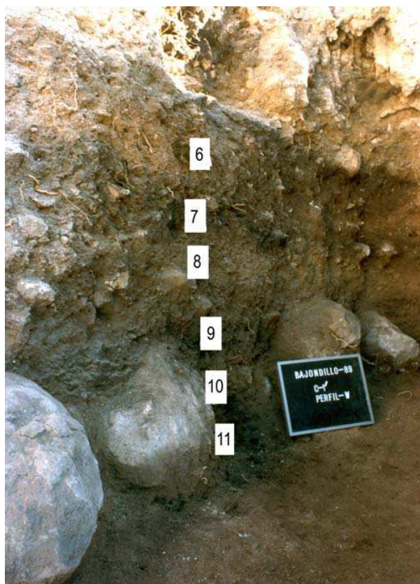
Figura 2. Bajondillo/1989. Perfil Corte 2.

Por último, cabe reseñar diversos indicios procedentes de Zafarraya y Gorham. Así, cabe recordar que Zafarraya constituyó durante varios lustros un pilar esencial para sustentar la perduración del Paleolítico medio meridional ibérico. No obstante, la información publicada en la memoria definitiva sobre el yacimiento (Barroso y de Lumley, 2006), así como las nuevas dataciones ^{14}\text{C} /AMS-ultrafiltración obtenidas (Wood y Higham, 2009), no sólo envejecen sustancialmente los niveles musterienses más recientes ( ca. 50-35 Ka BP, Barroso et al. , 2006: 521) sino que además han termi-