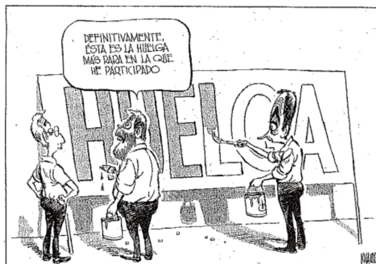
El Mundo , 29 de septiembre de 2010