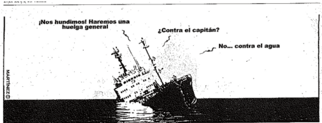
El Mundo , 27 de septiembre de 2010