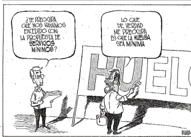
El Mundo , 21 de septiembre de 2010

Tres ejemplos de El Mundo y su visión de que la Huelga no va a tener ni repercusión ni sentido, hasta puede estar “bien vista” por el Gobierno y donde el Sindicato UGT “pinta más” que CC.OO.