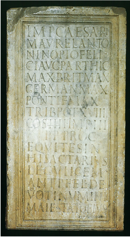
Figura 1. Cara frontal, con inscripción votiva de los equites leg. VII Geminae honrando al emperador Caracalla.