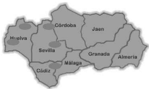
Fig. 1. Localisation géographique des cinq zones d'étude.