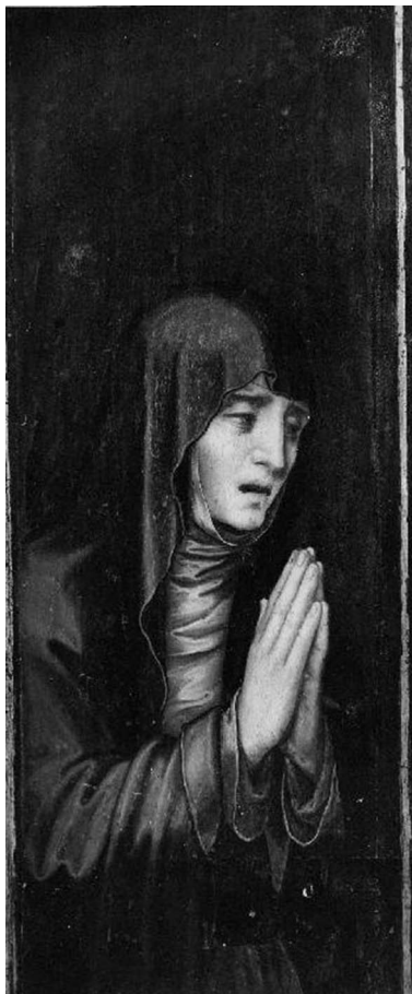
Figura 2. Tríptico del Ecce Homo. (det.) Tabla de la Dolorosa. Luis de Morales. Catedral de Sevilla. Sacristía de los Cálices.