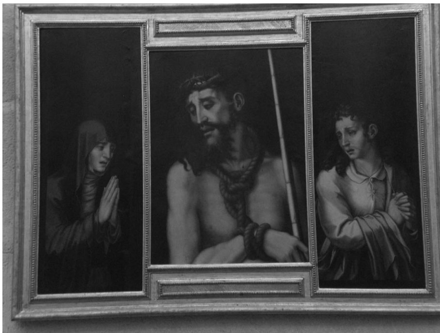
Figura 4. Tríptico del Ecce Homo, después de la restauración realizada en el año 1996. Luis de Morales. Catedral de Sevilla. Sacristía de los Cálices.