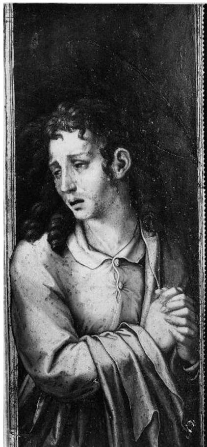
Figura 3. Tríptico del Ecce Homo.(det.) Tabla de San Juan Evangelista. Luis de Morales. Catedral de Sevilla. Sacristía de los Cálices.