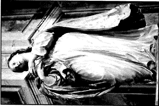
Pedro Duque Cornejo. Santa Rosalía. 1711. Iglesia de San Alberto.

Duque Cornejo representó la Apoteosis de este Santo florentino, canonizado el 12 de mayo de 1622 junto con los españoles Teresa de Jesús, Ignacio de Loyola, Francisco Javier e Isidro Labrador; de ahí que figure arrojado sobre un cúmulo de nubes, con la cabeza alzada hacia los cielos, y