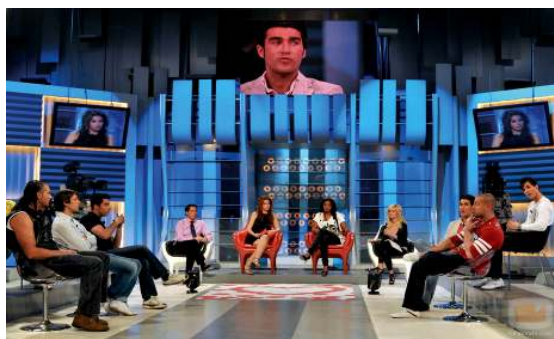
Imagen del plató de 'Mujeres, hombres y viceversa', de Telecinco.

Es frecuentemente criticado el uso y abuso de la estética femenina en la televisión italiana, hecho que se puede ver en el reciente documental “Il Corpo della donna”. En este documental, realizado por periodistas críticos italianos, se analizan los contenidos de la televisión italiana y se muestra el uso de la mujer como un juguete artificial que va en una continua lucha contra el tiempo. En Italia las operaciones de cirugía estética se disparan, se rechaza la vejez femenina, se exige una figura esbelta y una vestimenta determinada. Este tipo de mujer ya ha llegado a España.