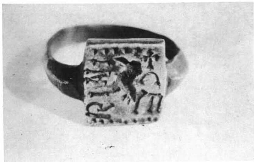
Anillo con inscripción procedente de «El Santiscal»