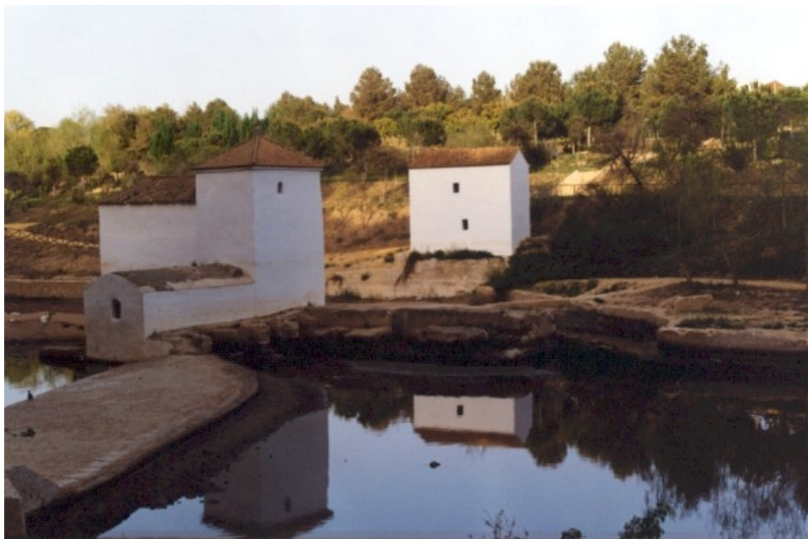
Fig.6. Molino de San Juan (Alcalá de Guadaíra)