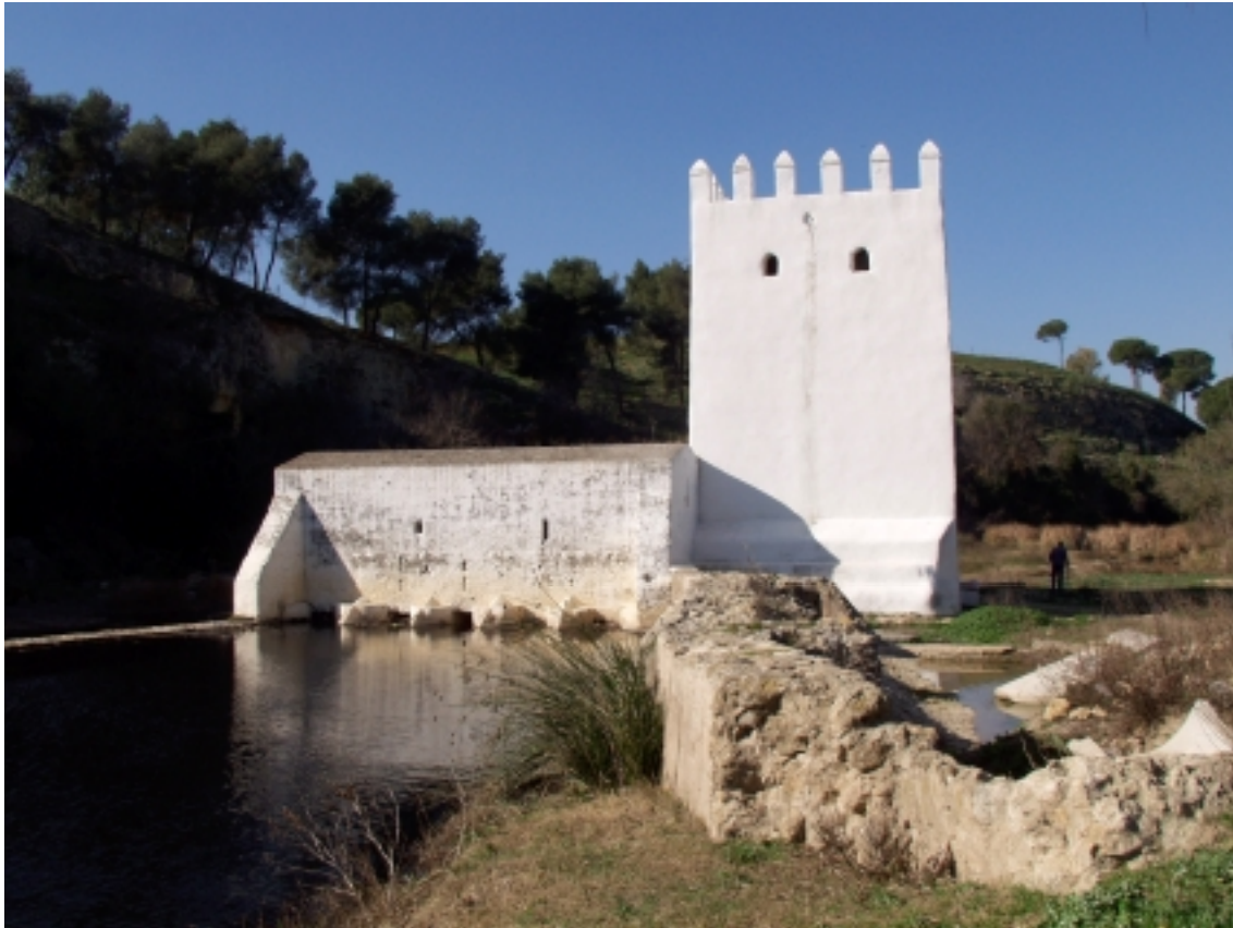
Fig.4. Molino de la Aceña (Alcalá de Guadaíra)

Posiblemente sea Alcalá de Guadaíra la primera población andaluza en número de molinos de agua. Entre los siglos XV y XVI, la antigua Alcalá de los Panaderos llegó a contar con 40 molinos, en el siglo XIX se citan 30 y en la actualidad quedan 24. Nombres como Cerrajas, Pelay Correa, Realaje o Piealegre, Arrabal, Algarrobo, la Tapada, las Eras, San Juan, Benaharosa o Benarosa, Aceña Trapera, San José, Rincón, Hundido o San Pedro son una pequeña muestra de la serie de interesantísimos artefactos que aún puedan visitarse en sus inmediaciones, bien en el mismo río Guadaíra bien en sus afluentes de Marchenilla y Gandul.