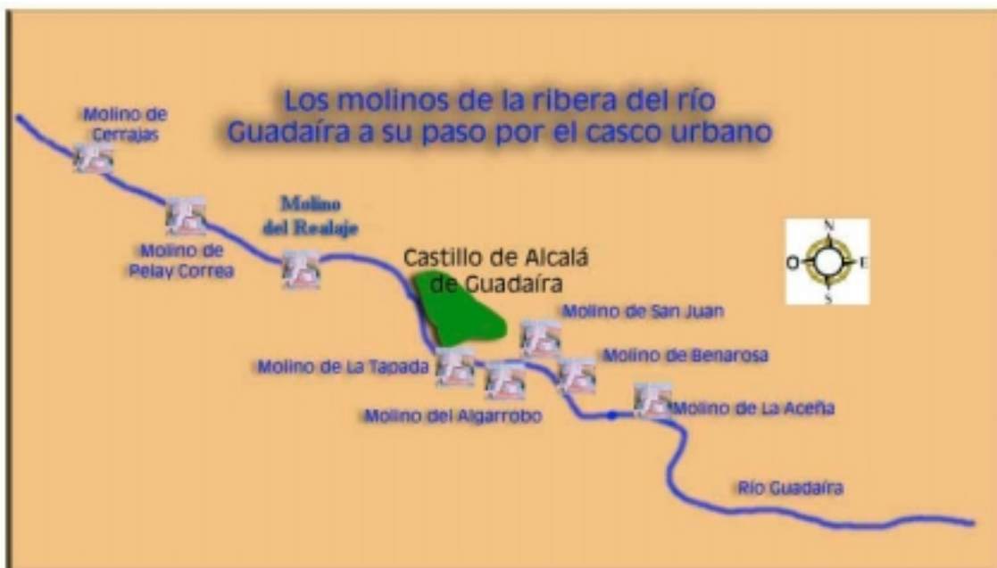
Fig.3. Situación de los molinos en la ribera del río en Alcalá de Guadaíra

El río Guadaíra nace en la Sierra de Pozoamargo (Cádiz), junto a Morón de la Frontera (Sevilla), desembocando en el Guadalquivir a unos 20 Km al sur de la capital hispalense. Su curso tiene unos 110 Km de recorrido y su cuenca hidrográfica se extiende por los términos municipales de Morón, Marchena, Utrera, Paradas, Arahal, Mairena del Alcor, El Viso del Alcor, Alcalá de Guadaíra, Sevilla y otros. Sus afluentes principales son el Guadairilla, Alameda, Salado y Saladillo, que conforman una red dendrítica subparalela poco ramificada. Lo más característico de este río es la abundancia de molinos harineros o aceñas que jalonan su curso, abundancia que lo hace único en Andalucía, llegando a ser una verdadera seña de identidad en el municipio de Alcalá de Guadaíra.