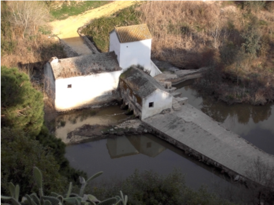
Fig.5. Molino de Benarosa (Alcalá de Guadaíra)