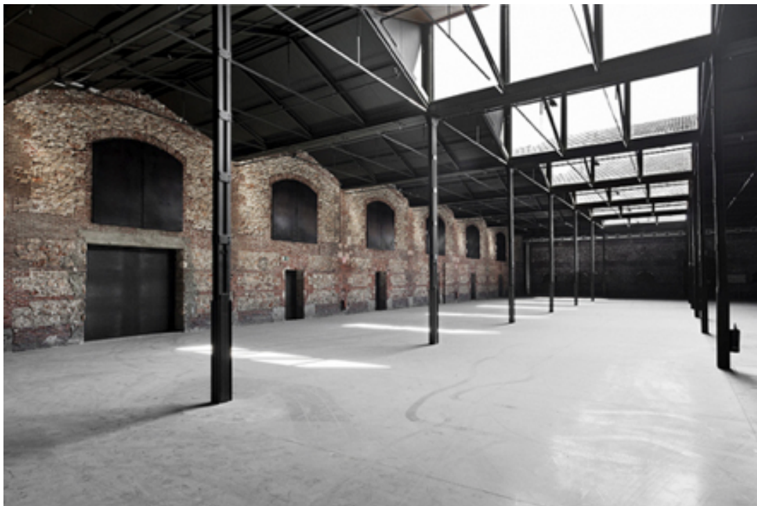
Naves del Matadero. Madrid

El sol se filtra por las altas ventanas. En un rincón hay una mesa con papeles, fotos, documentos, libros de poesía, el ordenador. La amplia nave está atravesada desde arriba por rayos de luz.