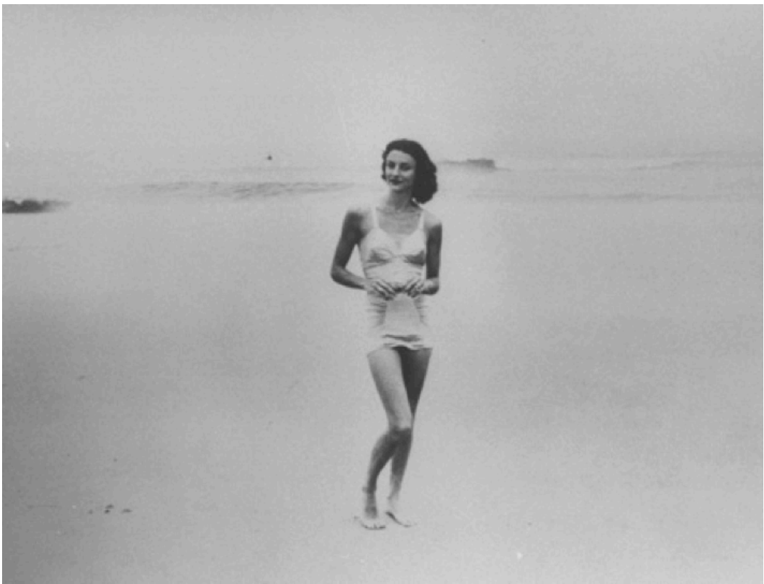
Fotografía Anne Sexton publicada en su biografía