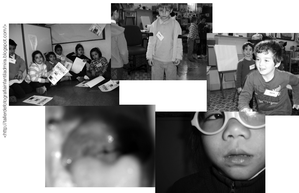
As imagens realizadas pelas crianças em sentido horário: Plano Geral, Plano Americano, Plano Médio, Primeiro Plano e... uma tentativa de Plano Detalhado.

explicação. Como é natural, pretendia-se mostrar a estrutura geral da câmara parte por parte, mas o interesse delas recaía em utilizar o disparador e ver o mundo; muitas tinham se adiantado e já sabiam até como ver a fotografia realizada. Este processo foi proveitoso na medida em que podiam verificar se o plano alcançado era o plano que pretendiam fazer. Logicamente, para aquele momento, os planos principais (geral, americano, médio, primeiro plano e plano detalhe) já tinham um lugar em sua memória. Apesar de esta terminologia ser uma novidade para elas, os exemplos empregados para identificar a taxonomia dos planos surtiram efeito em sua memória. É preciso que sejam imagens ou gráficos que chamem a atenção das crianças e que descrevam explicitamente o significado do plano em questão. O autorretrato é, por outro lado, uma atividade quase cotidiana dos adolescentes na atualidade, seja para colocar na internet, seja para usar no celular; é fácil encontrar imagens de garotos e garotas que se autofotografam, sozinhos ou com amigos. No caso dos menores, essa atividade chamou sugestivamente a atenção, pois não pensavam que eles mesmos pudessem se retratar e, o que é ainda melhor, não sabiam que gesto fazer diante da câmara, pois não tinham a possibilidade de olhar na tela. Foram bastante engenhosos e utilizaram os objetos que refletiam, tais como espelhos, vidros ou elementos metálicos.