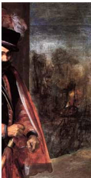
Figura 8. VELÁZQUEZ. El bufón llamado don Juan de Austria , hacia 1632-47. Madrid, Museo del Prado (detalle).