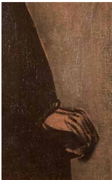
Figura 7. VELÁZQUEZ. Retrato de hombre joven , hacia 1628. Munich, Alte Pinakothek (detalle).