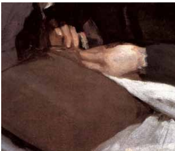
Figura 6. VELÁZQUEZ. La costurera , hacia 1650. Washington, National Gallery of Art (detalle).