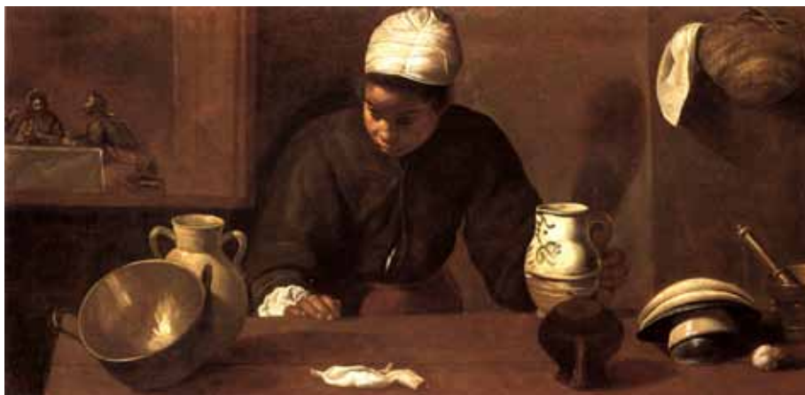
Figura 4. VELÁZQUEZ. La mulata , 1617. Dublin, National Gallery of Ireland.