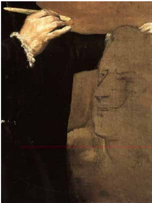
Figura 5. VELÁZQUEZ. Retrato de Martínez Montañés , hacia 1635-6. Madrid, Museo del Prado (detalle).