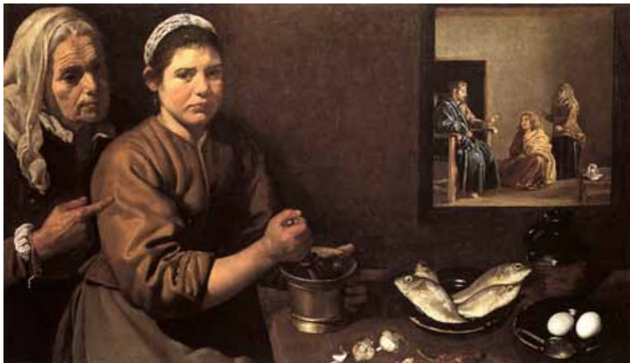
Figura 3. VELÁZQUEZ. Cristo en casa de Marta y María , hacia 1618-20. Londres, National Gallery.