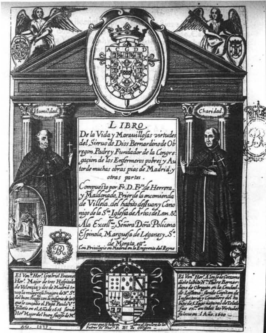
Fig. 4: Portada del Libro de la Vida y Maravillosas virtudes del Siervo de Dios Bernardino de Obregón, Padre y Fundador de la Congregación de los Enfermeros pobres y Autor de muchas obras pias de Madrid, y otras partes. Con Privilegio en Madrid en la Empresa del Reyno. Madrid, 1634