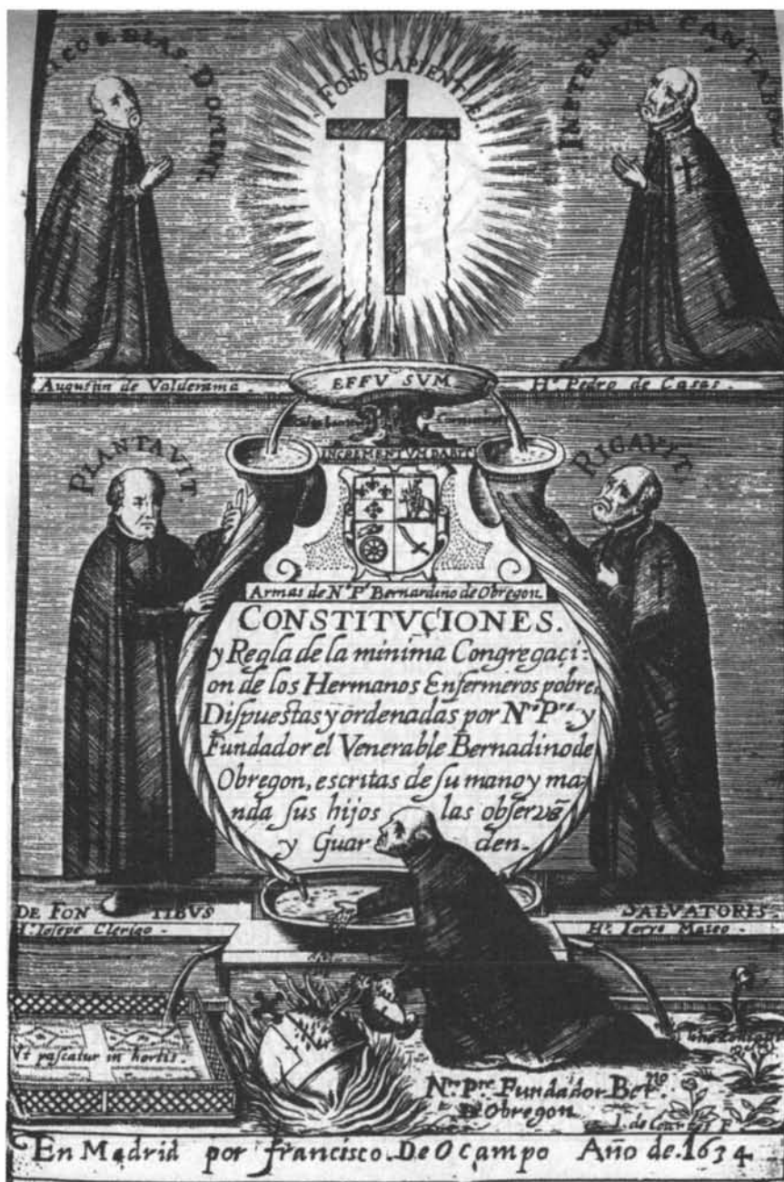
Fig. 3: Portada de las Constituciones y Regla de la Mínima Congregación de los Hermanos Enfermeros Pobres , impresas en Madrid, en 1634.