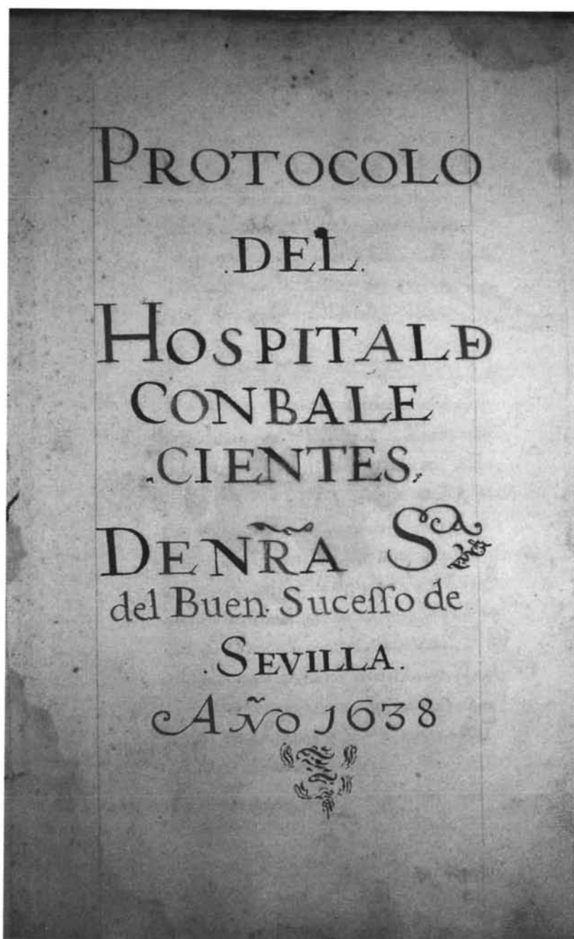
Fig. 5: "Protocolo del Hospital de Convalecientes de Nra. Sra. del Buen Sucesso de Sevilla. Año 1638", fundado y regentado por los enfermeros obregones hasta el siglo XIX.