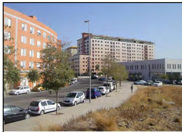
Foto 9. Bloques de viviendas y equipamientos levantados en las inmediaciones del espacio que ocupaba el poblado de Bermejales. Elaboración propia.

En este caso no se puede hablar, en modo alguno, de un plan o modelo de intervención al respecto. La estrategia seguida no fue otra que la de propiciar el desalojo de los terrenos situados al sur de Bermejales mediante la entrega de una cantidad económica a las familias allí asentadas, 42.000 € para cada una de las conformadas en aquel momento. Esta operación, que esperaba que tales familias invirtieran tal dinero en conseguir una vivienda, sin ningún tipo de control o regulación sobre cuándo, dónde ni cómo debía realizarse esta compra, consiguió únicamente lo que parecía ser su objetivo primordial: liberar aquellos terrenos de “personas marginales y molestas” y contar con el suelo para destinarlo a la construcción de nuevos bloques de viviendas.