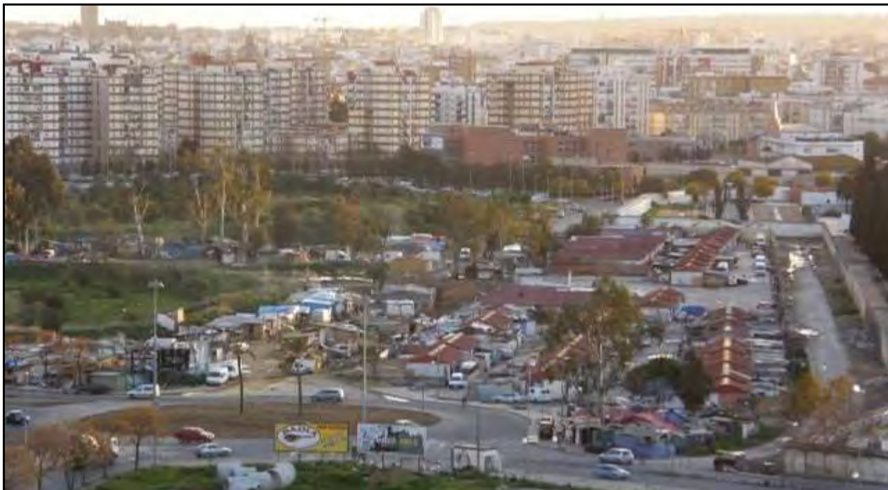
Foto 1. Perspectiva área del Vacie que lo contextualiza en relación al sector norte de la ciudad y el centro histórico. Autor: Antonio López Gándara.

servicios sociales, la escolarización de los menores, etc., y el relativo aislamiento al que contribuyen los factores ya señalados; éstos son remarcados además por la posición exacta de las chabolas y módulos, alejados de la ronda de circunvalación (el poblado ha terminado prácticamente pegado a la tapia del cementerio), y la cierta ocultación que generan los árboles que delimitan el solar en que se localiza.