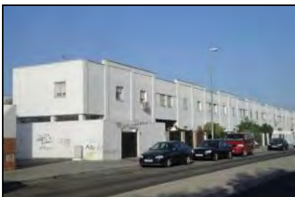
Foto 7. Tipología de viviendas en las que fueron realojadas algunas de las familias gitanas del poblado que existía en el lugar. Calle Baltasar.