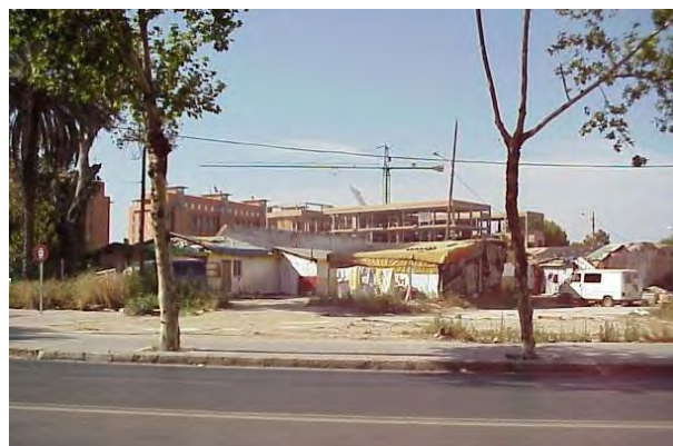
Foto 8. Imagen de las chabolas que existían en el entorno de la torre Perdigones.

Según la información contenida en el Informe Especial elaborado por el Defensor del Pueblo Andaluz (2005), los chabolistas de Perdigones se dispersaron de la siguiente manera: varias de las familias se fueron al Polígono Sur, comprando viviendas no regularizadas; otras se fueron a una urbanización ilegal en Alcalá de Guadaíra; el resto, se desconoce dónde pudieron terminar residiendo.