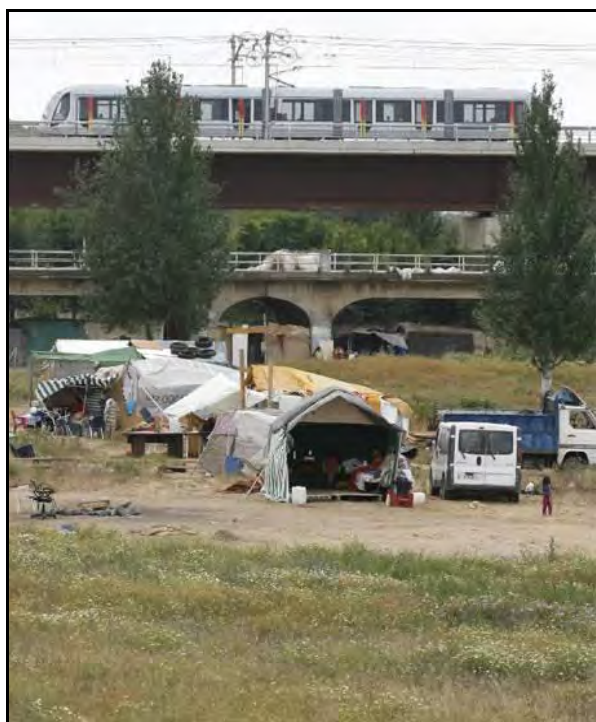
Foto 5. Chabolas junto al puente de San Juan.

Por otra parte, desde hace algunos años, el problema del chabolismo en Sevilla se ha diversificado a partir de la llegada de familias gitanas de origen rumano. Algunas de estas familias se instalan en campamentos muy precarios, con tiendas de campaña que reúnen junto a sus vehículos, construyendo pequeños asentamientos que suelen ser desmantelados por la policía en poco tiempo. Esta nueva vertiente del fenómeno chabolista, en la que se acumulan tres graves factores de vulnerabilidad y exclusión (inmigración, etnia gitana, chabolismo) representa un importante reto en relación al enfoque y tratamiento que debe recibir por parte de las administraciones, hasta ahora centradas en una labor fundamentalmente policial.