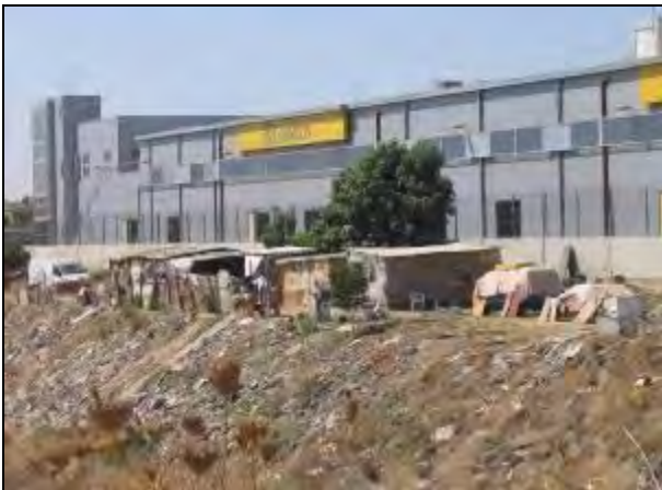
Foto 4. Chabolas junto al canal de Ranillas.

desde la ronda. Resulta sorprendente cómo aquella destartada composición de chapas, maderas y cartones, en un entorno semejante al de algunos núcleos chabolistas del Tercer Mundo, encontraba su refugio en un espacio de esas características, guardando un equilibrio imposible sobre muy pocos metros de tierra firme, entre la pared y esa infesta pendiente que podía convertir un despiste o mal paso en una desgracia. Entendí entonces que aquella segunda parada en el recorrido también estaba justificada por las condiciones de vida que se escondían en ese insólito lugar. En este caso, los derechos humanos socavados afectaban muy especialmente a la necesidad de vivienda que tienen esas personas y a la dignidad que deben tener los alojamientos en los que vivan” (Torres, 2009).