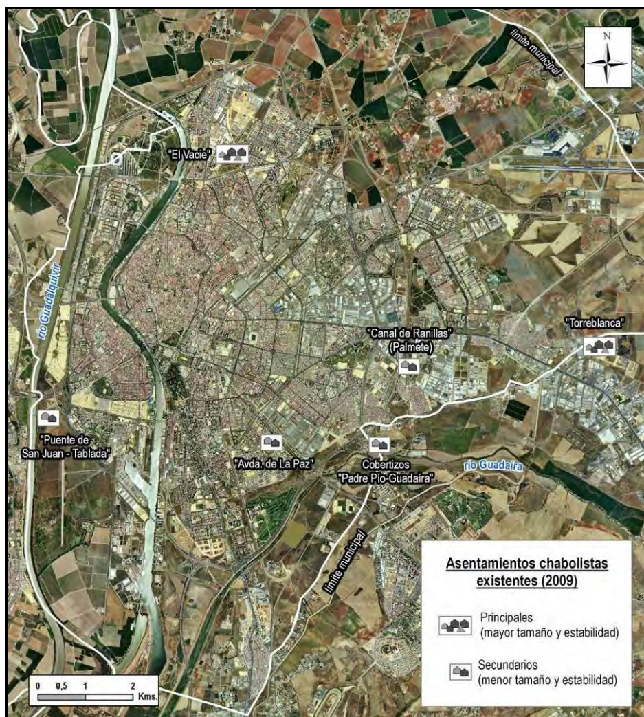
Figura 1. Distribución urbana de los asentamientos chabolistas existentes en Sevilla (2010).

vigente de dismantelar progresivamente El Vacie, nos incita a practicar un escueto análisis así como una interpretación de las desiguales experiencias conocidas al respecto en Sevilla: subrayamos el relativo éxito de la planteada en el área de San Diego-Los Carteros a finales de los años noventa, frente a otras operaciones que, ya acontecidas en la pasada década, consideramos cuestionables, como la de Perdigones, y claramente inaceptables, como la de Bermejales.