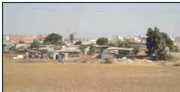
Foto 6. Perspectiva del asentamiento desde los terrenos de la Universidad Pablo de Olavide. Elaboración propia.

Dos ejemplos de este tipo aparecen recogidos en los documentos del nuevo Plan General (PGOU de 2006) 11 con la catalogación de “núcleos de chabolas”. Ambos están situados próximos a los barrios de Palmete, en el borde ESE de la ciudad, en unos terrenos emplazados entre la ronda SE-30 y su variante de conexión con la A-92 y el cauce del río Guadaíra. Se trata de un ámbito territorial muy desordenado, compartimentado por infraestructuras muy diferentes y con diversos usos entremezclados, todos ellos con una apariencia muy informal. Probablemente, estos núcleos apoyen su subsistencia en estas condiciones de desorden y marginalidad urbanística, aspectos a los que se suma, nuevamente, el hecho de ubicarse, justamente, en el límite municipal entre Sevilla y Alcalá de Guadaíra.