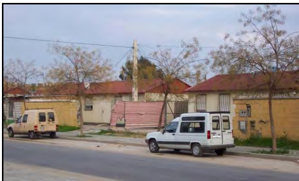
Foto 3. Viviendas prefabricadas en Polígono Sur (año 2002). Actualmente sólo quedan unos pocos módulos junto al ya construido Centro de Servicios Sociales.

Curiosamente, una de las dificultades que han encontrado asentamientos como éste para su erradicación, ha sido la propia definición de “núcleo chabolista” que establecía el Plan Integral de Erradicación del Chabolismo. Según el texto del Defensor del Pueblo Andaluz en su Informe al Parlamento de 2001, la Consejería de Obras Públicas y Transportes de la Junta de Andalucía (ámbito político-administrativo al que se adscribe el Plan) no consideraba “chabolas” este tipo de viviendas, a pesar de que, en muchos casos, y éste de La Paz es uno representativo, el estado de aquéllas ha empeorado con el tiempo llegando a convertirse claramente en infraviviendas. Según actuaciones emprendidas con posterioridad en otros asentamientos (el de La Paz-Las Letanías sigue vigente), este criterio de la administración autonómica parece haberse corregido.