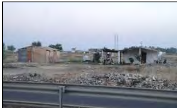
Foto 2. Imagen de algunas de las construcciones dispersas de este poblado próximo a Torreblanca. Elaboración propia.

próximas a la carretera A-8026 o se disponen junto a los pequeños senderos que se ramifican por el interior de terrenos baldíos, los cuales están comprendidos en un espacio con forma de cuña flanqueado por suelos industriales.