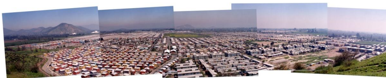
Figura 4. Villa Serviu, Puente Alto, Santiago de Chile.

El subsidio habitacional chileno es un modelo que los demás países de América Latina están copiando. En la Ciudad de México, por ejemplo, las extensiones de viviendas producidas en serie con apoyo estatal de subsidios son manchas uniformes de hasta 50.000 unidades. Son barrios amorfos, alejados de los centros de trabajo y de servicios. Su destino poco digno es ir sumándose a la nomenclatura del hábitat de los que sobran .