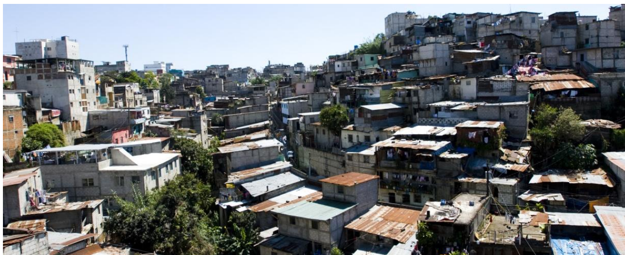
Figura 2. La Limonada, Guatemala.

que marcan la calidad de vida en La Limonada, al igual que en otros asentamientos colgados en las vertientes de otros barrancos, como El Incienso, y en todos los barrios históricos y populares de la Ciudad de Guatemala. Las élites viven moviéndose, solo en carro , entre la casa enrejada en barrios cerrados, los malls y las oficinas dotadas de altos sistemas de seguridad, la finca y el aeropuerto.