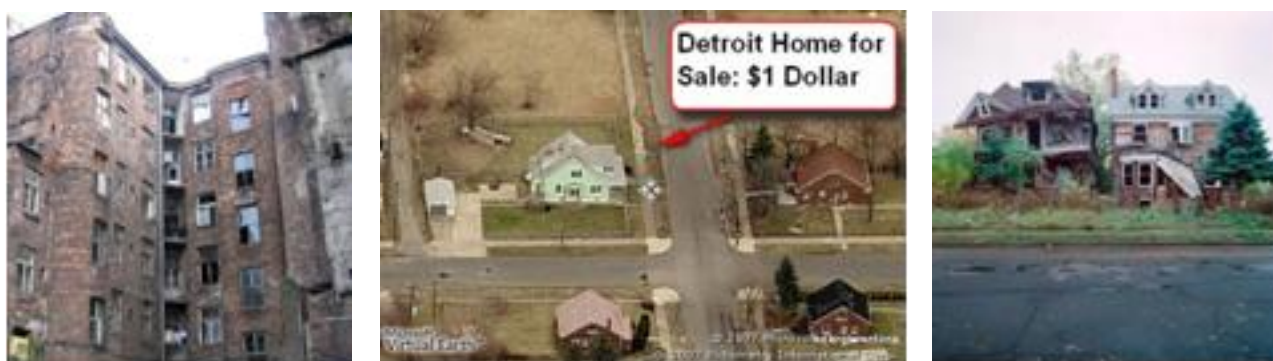
Figura 5. Edificio en Detroit (izqda). Casa por un dólar (centro). Casas en Detroit (dcha). Fuente: Izqda: < http://drpinna.com/empty-city-streets-now-detroit-17347 >. Centro: < http://www.zillow.com/blog/2008-08-14/1-will-buy-you-a-home-in-detroit/ > Dcha: < http://www.victoryinstitute.net/blogs/utb/2011/02/who-won-world-war-ii/ >.

Ahora, Detroit está en crisis y su hemorragia laboral y poblacional es evidente para cualquiera que lo visite: en el centro de la ciudad, está a la vista el abandono de edificios enormes, más antiguos y más recientes; un viernes por la tarde parece un desierto. Se salvan dos bolsones de vida, uno en torno a los restaurantes de Mexican Town , debajo de los enlaces de autopistas del puente frente al centro y la atracción turística de los casinos de Greek Town . Los barrios de los obreros muestran casas abandonadas y en estado de deterioro progresivo; al frente de estas viviendas, se mantienen anuncios de venta; se han visto pancartas declarando el valor de la venta en un dólar. Las antiguas plantas, también abandonadas, son verdederos nauseabundos. A estos distintos espacios muertos y podridos, los locales los llaman slums .