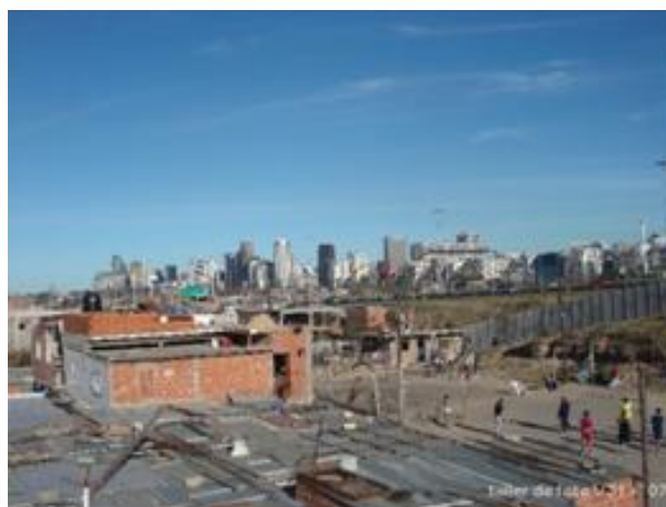
Figura 1. Villa 31, Buenos Aires (izqda y dcha).

ganización social del barrio cultiva el sueño de lograr algún día la tenencia de la tierra.