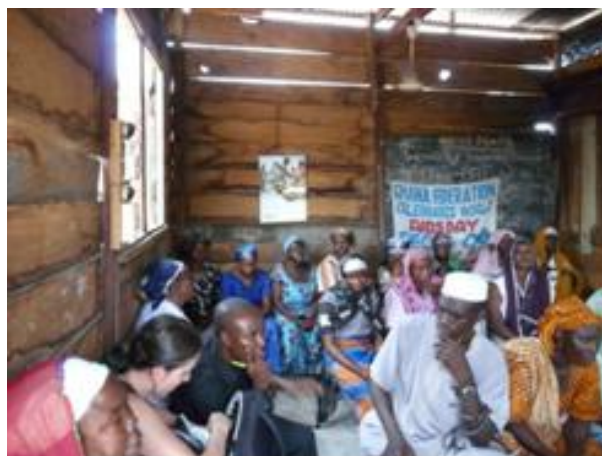
Figura 3. Old Fadama, Ghana, Africa (izqda y dcha).

cumpliendo con todos los requisitos de la ordenanza de construcción y urbanismo, entregando las casas llave-en-mano y en propiedad, con un alto porcentaje de subsidio, involucrando también al mercado financiero con la otorgación de créditos más allá de las capacidades de endeudamiento de los beneficiarios . El producto viene a ser una nueva forma de slum .